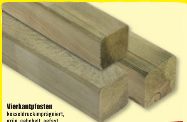
Vierkantpfosten kesseldruckimprägniert, grün, gehobelt, gefast, Holzart: Kiefer, versch. Größen