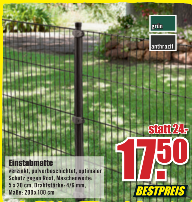
Einstabmatte verzinkt, pulverbeschichtet, optimaler Schutz gegen Rost, Maschenweite: 5 x 20 cm, Drahtstärke: 4/6 mm, Maße: 200 x 100 cm