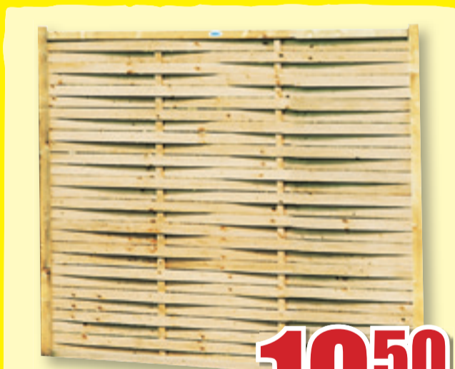
Lamellenzaun kesseldruckimprägniert, grün, Rahmenstärke: 18 x 43 mm, 180 x 180 cm (Abb. ähnl.)