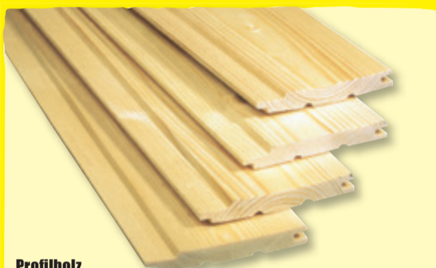
Profilholz Fichte/Tanne, B-Sortierung, 96 x 12,5 mm