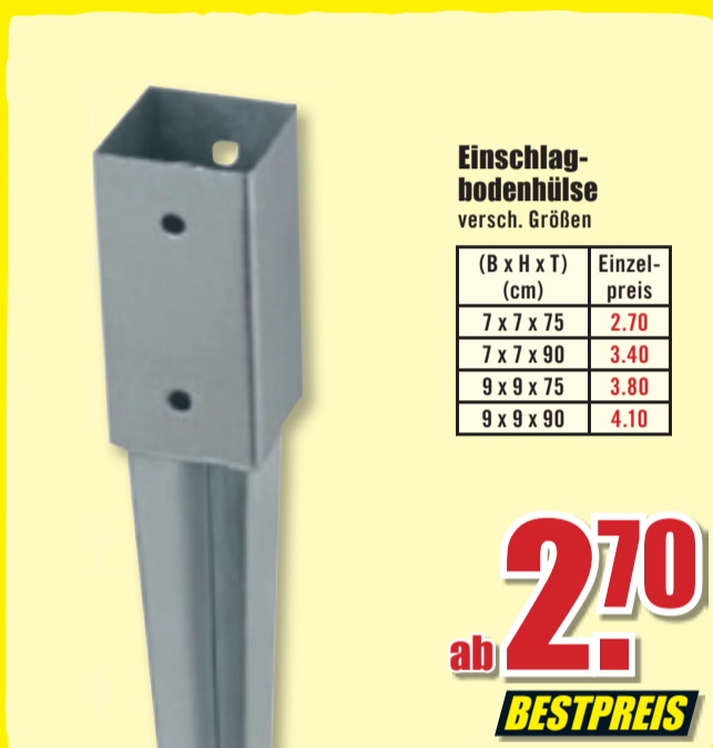
Einschlagbodenhülse versch. Größen