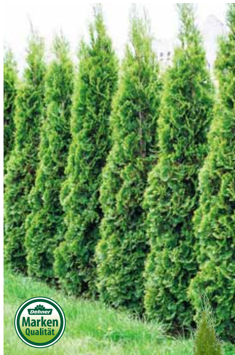
13 | LEBENSBAUM 'SMARAGD'

Thuja occidentalis gleichmäßig aufgebaute Kegelform, kein regelmäßiger Schnitt erforderlich, Höhe 40-60 cm, im 3-l-Topf 7513757 je 6.99 4.49