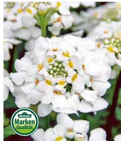
14 | SCHLEIFENBLUME

Iberis reicher Blütenflor im April und Mai, attraktiv und pflegeleicht, Topf Ø 11 cm 8005977