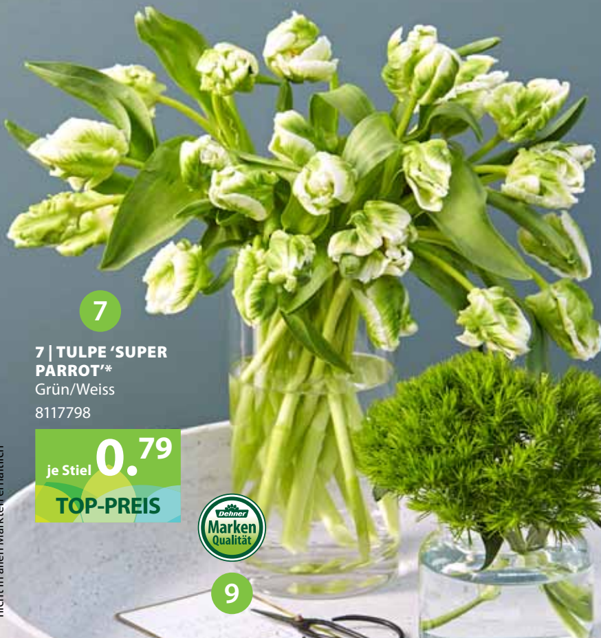
7 | TULPE 'SUPER PARROT' Grün/Weiss 8117798