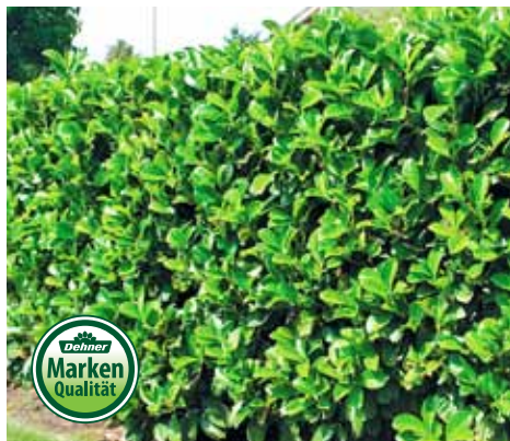
12 | KIRSCHLORBEER 'NOVITA'

Prunus laurocerasus mit kräftigem, grünen Laub, gut geeignet für Hecken, sehr schnittverträglich, im 2-l-Topf 7360639 je 9.99 7.99