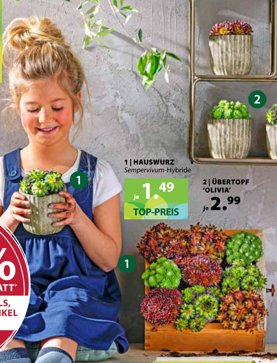
1 | HAUSWURZ Sempervivum-Hybride