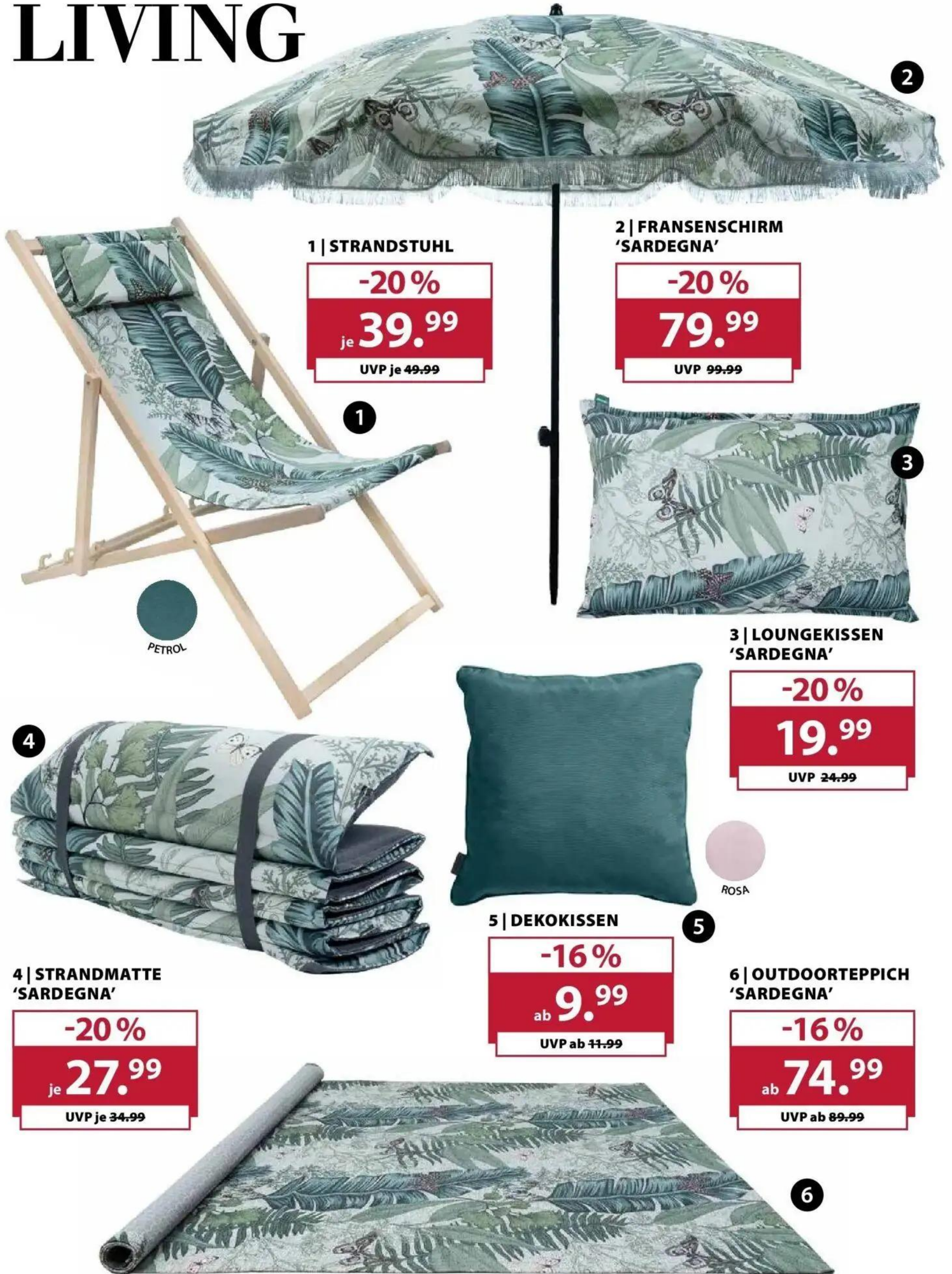
1 | STRANDSTUHL