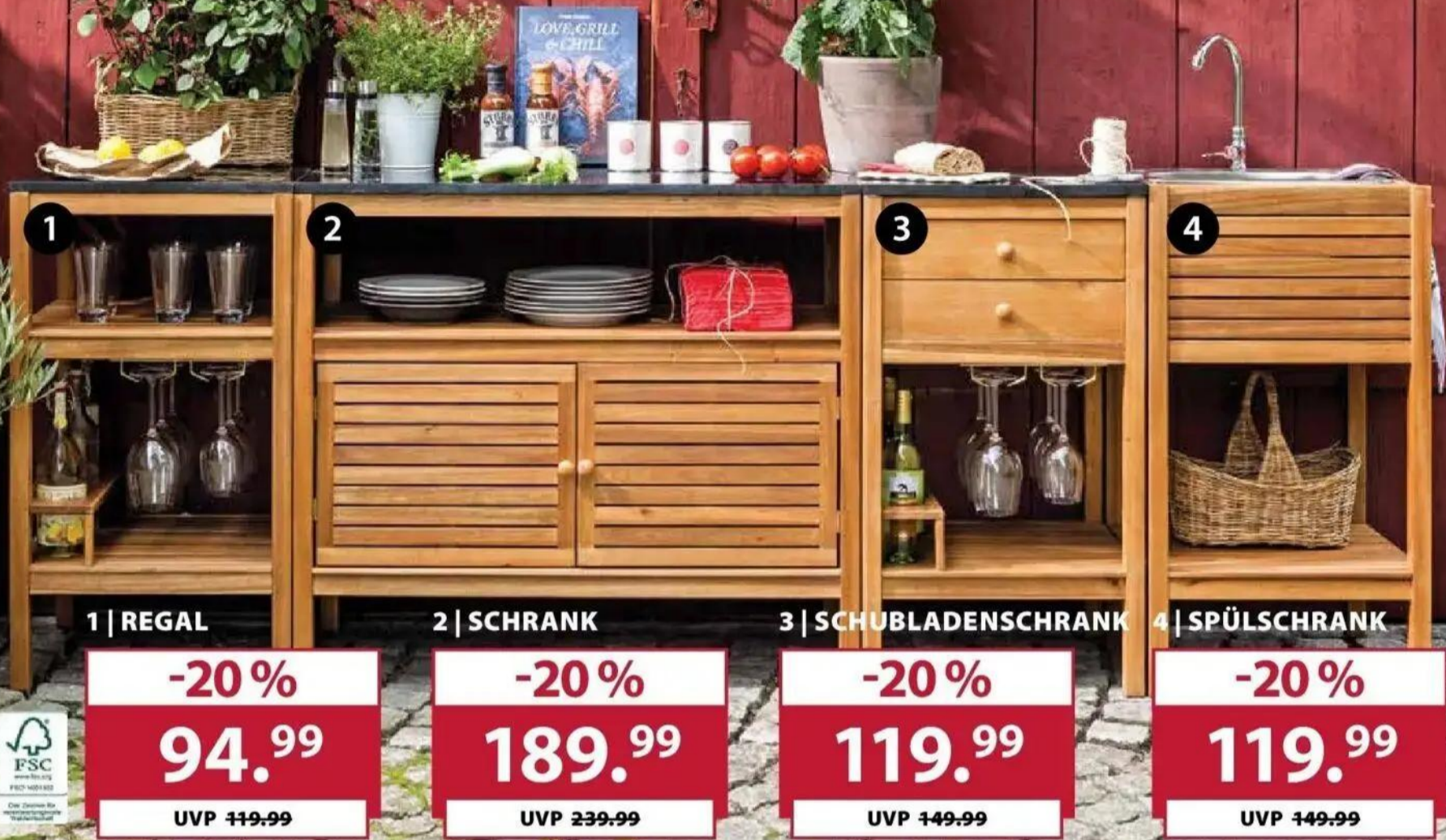
1 | REGAL

Mehr praktisches Grillzubehör finden Sie auf www.dehner.de/ grill