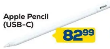
Apple Pencil (USB-C)