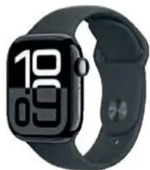
Apple WATCH SERIES 10