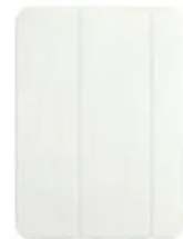
Apple Smart Folio weiß