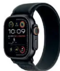
Apple WATCH ULTRA