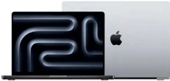
Apple MacBook Pro