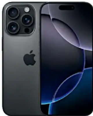
Apple iPhone 16 Pro