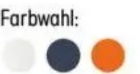
iPhone 17 Pro

vertragsfreies Smartphone iPhone 17 Pro" (256 GB)