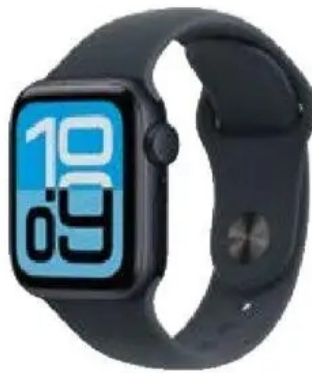
Apple WATCH SE 3

899,-** 0%-Finanzierung: 10x monatlich 89,90*