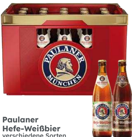
Paulaner Hefe-Weißbier verschiedene Sorten

je 20 x 0,5-l-MW- Flasche (L = 1,40) + Pfand 3,10