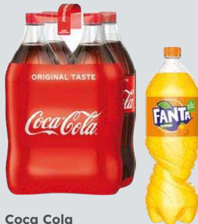
Coca Cola verschiedene Sorten

je 4 x 1,5-l-PET-EW-DPG- Flasche (L = 1,08) + Pfand 1,-