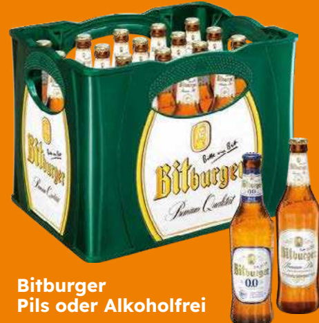
Bitburger Pils oder Alkoholfrei

je 20 x 0,5-l oder 24 x 0,33-l-MW-Flasche (L = 1,25/1,58) + Pfand 3,10/3,42