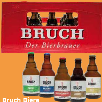
Bruch Biere verschiedene Sorten

je 20 x 0,33-l-MW- Flasche (L = 1,82) + Pfand 3,10