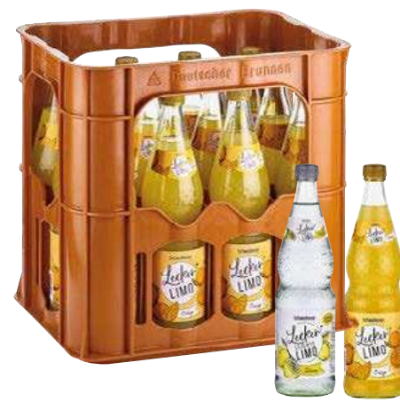
Schwollener Limonade verschiedene Sorten

je 12 x 0,7-l-MW-Flasche (L = 0,59) + Pfand 3,30