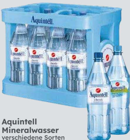
Aquintell Mineralwasser verschiedene Sorten

je 12 x 1-l-PET-MW- Flasche (L = 0,42) + Pfand 3,30