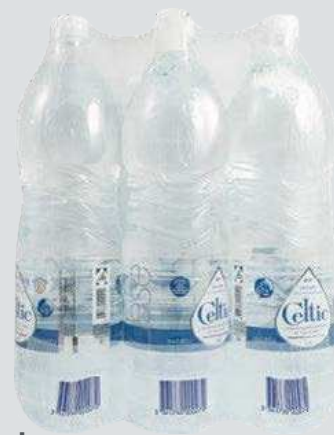
Celtic Mineralwasser Naturell

je 6 x 1,5-l-PET-EW- Flasche (L = 0,31) + Pfand 1,50