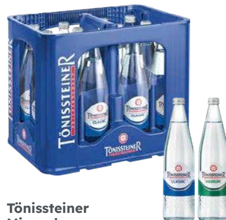
Tönissteiner Mineralwasser verschiedene Sorten

je 12 x 0,75-l-MW- Flasche (L = 0,44) + Pfand 3,30