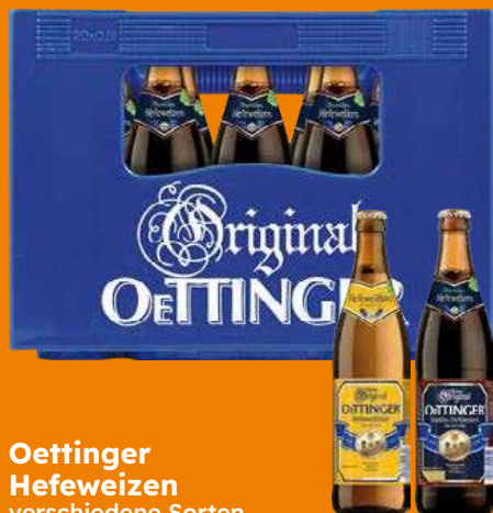
Oettinger Hefeweizen verschiedene Sorten

je 20 x 0,5-l-MW- Flasche (L = 0,90) + Pfand 3,10