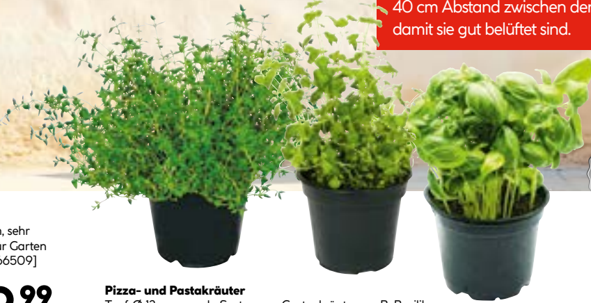
Pizza- und Pastakräuter Topf-Ø 12 cm, versch. Sorten von Gartenkräutern, z. B. Basilikum, Oregano oder Thymian [915795]