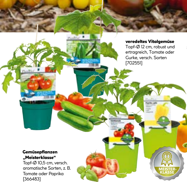
veredeltes Vitalgemüse Topf-Ø 12 cm, robust und ertragreich, Tomate oder Gurke, versch. Sorten [702551]