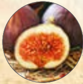
Feigenbaum Ficus carica Topf-Ø 20 cm, sehr ertragreich, für Garten und Kübel [366509]