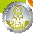
Gemüsepflanzen „Meisterklasse“ Topf-Ø 10,5 cm, versch. aromatische Sorten, z. B. Tomate oder Paprika [366483]