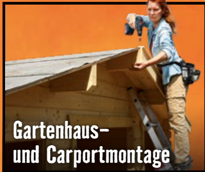
Gartenhaus- und Carportmontage