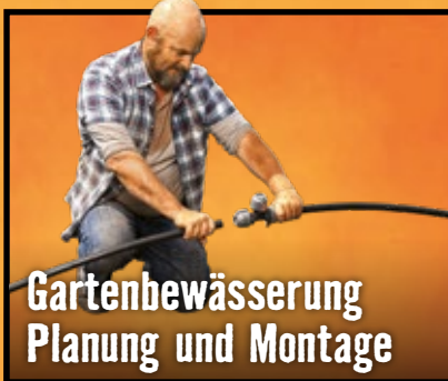
Gartenbewässerung Planung und Montage