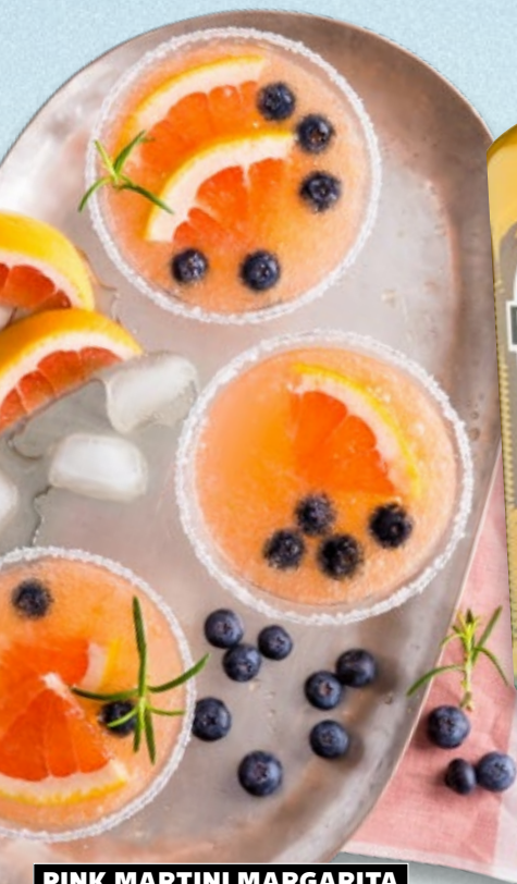
PINK MARTINI MARGARITA kaufland.de/rezepte-der-woche