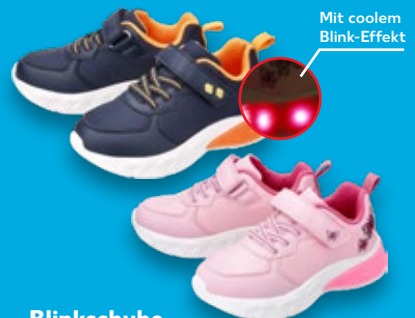
Mit coolem Blink-Effekt

Blinkschuhe aus Textil und PU, Mesh-Futter, EVA-Laufsohle mit Gummieinlage, 25 - 30 je Paar