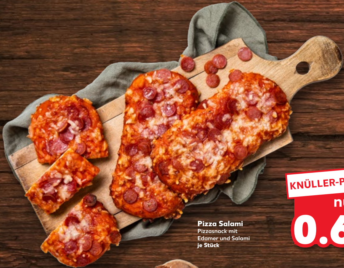
Pizza Salami Pizzasnack mit Edamer und Salami je Stück