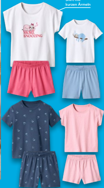
Shirt mit kurzen Ärmeln

Pyjama aus Baumwolle, 98/104 - 122/128 je 2-teilig