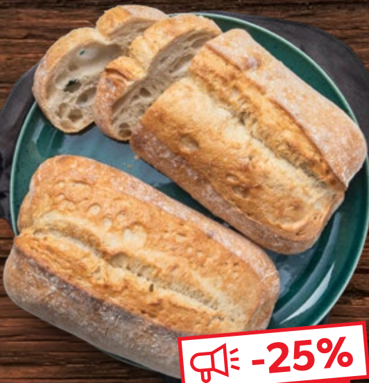
Ciabatta natur Weizenbrot nach ital. Art je 300-g-Stück (1 kg = 1.97)