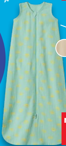
Besonders weiche Qualität

Muselinschlafsack TOG 0,5, aus Baumwolle, 70 - 110 je