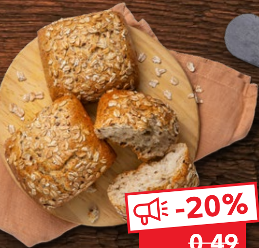
Dinkelvollkornbrötchen mit Sonnenblumenkernen und Dinkelweizenvollkornflocken je Stück