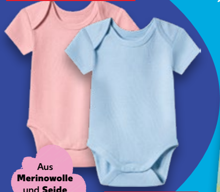
Aus Merinowolle und Seide