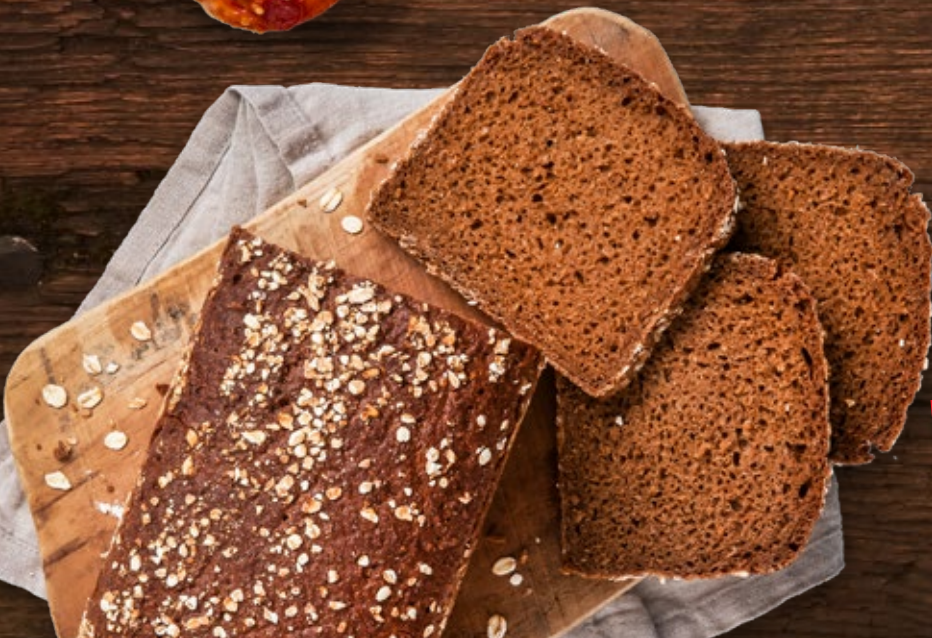
Roggen- Vollkornbrot mit Natursauerteig je 1-kg-Stück