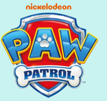
Samt-Kissen versch. Designs, ca. 40 x 40 cm, je