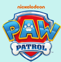
Plüschi versch. Ausführungen, ca. 25 cm, je