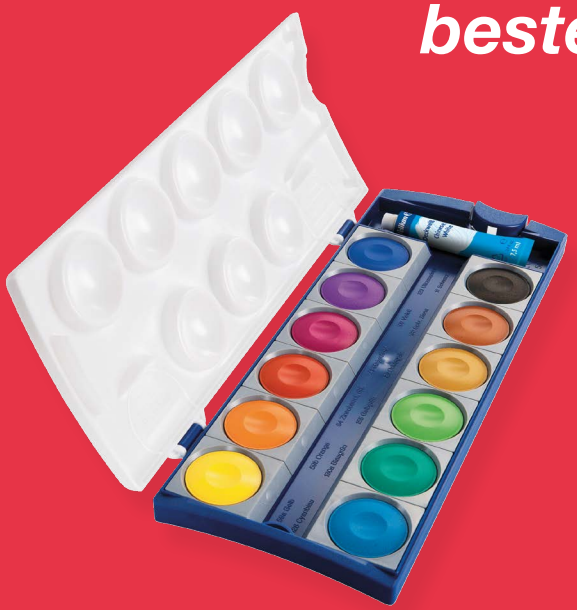
1x Pelikan Deckfarbkasten K12, die Nr. 1 in der Schule, 12 Qualitätsfarben + Deckweiß, auswechselbare Farbschälchen