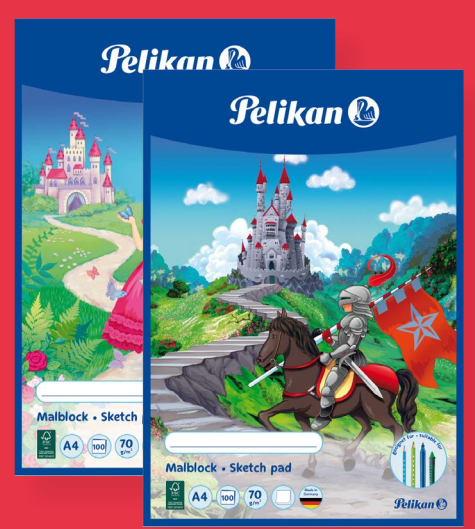
1x Pelikan Malblock, A4, 100 Blatt, versch. Motive