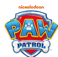
Radierbarer Gelstift versch. Designs, je