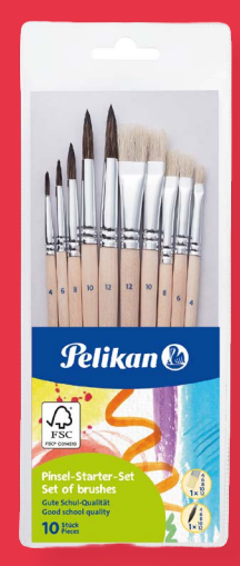
1x Pelikan Pinsel Starter-Set