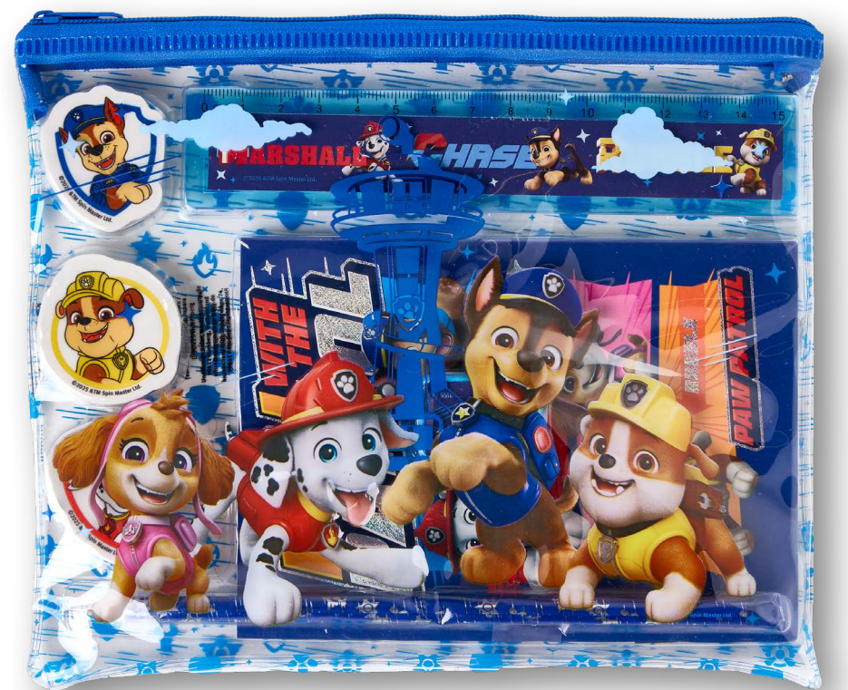
Gefülltes Etui 8tlg. versch. Designs, Inhalt: Softcover Notizbuch, Bleistift, Anspitzer, Lineal, 3 Radiergummis, je