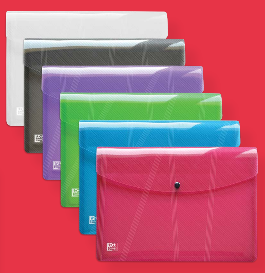
1x Oxford Brieftasche A4 „hawai“, versch. Farben