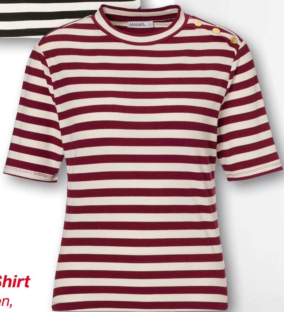
Damen T-Shirt versch. Farben, Gr. XS-XL, je