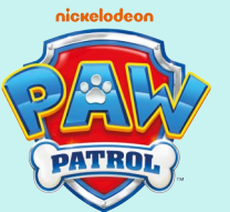
Kuscheldecke versch. Designs, ca. 130 x 170 cm, je