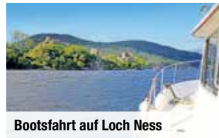
Bootsfahrt auf Loch Ness

Fotostopp am Loch Lomond und Fährfahrt auf die Isle of Bute. Erste von zwei Übernachtungen im The Glenburn Hotel in Rothesay im Süden der Insel.