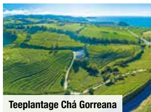
Teeplantage Chá Gorreana

Tag 8: Rückflug voller wunder-schöner Eindrücke nach Hause.