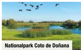
Nationalpark Coto de Doñana

Ganztagesausflug „Nationalpark Coto de Doñana, El Rocío & Freizeit in Matalascañas“ inkl. Fahrt durch den Nationalpark & Besuch des Pilgerortes El Rocío € 79 p. P. Bei Vorabbuchung sparen Sie € 10 p. P. € 69 p. P.