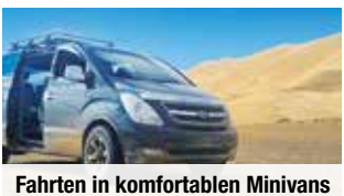
Fahrten in komfortablen Minivans

Tag 8: Fahrt durch das malerische Orchon-Tal (UNESCO), die „Wiege der Mongolei“.