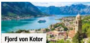
Fjord von Kotor