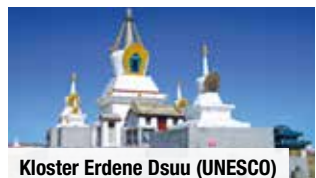
Kloster Erdene Dsuu (UNESCO)

Tag 6: Fahrt nach Bajandsag zu den glühenden Felsen in der Wüste Gobi mit Spaziergang und Beobachtung des Sonnenuntergangs.