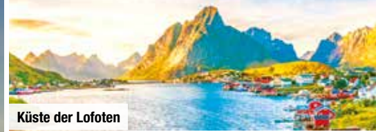
Küste der Lofoten

Tag 12: Über die Öresundbrücke reisen Sie nach Hause.