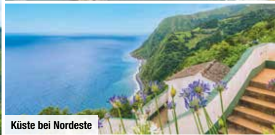
Küste bei Nordeste