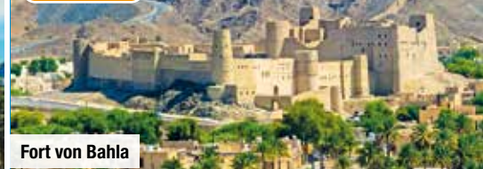
Fort von Bahla