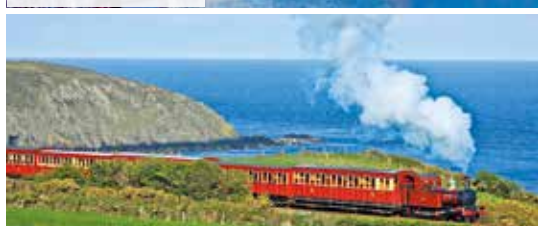
Nostalgische Zugfahrten auf der Isle of Man