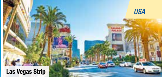
Las Vegas Strip

Beantragung der Einreiseerlaubnis ESTA über trendtours € 69 p. P.