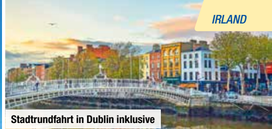
Stadtrundfahrt in Dublin inklusive

Inklusive Dublin, Cliffs of Moher, Kilkenny, Limerick u. v. m.