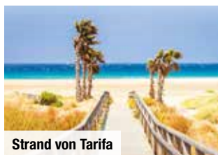
Strand von Tarifa

Tag 7: Auf diesem Ganztagesausflug betreten Sie in Gibraltar britischen Boden, auf dem Sie zollfrei shoppen können.