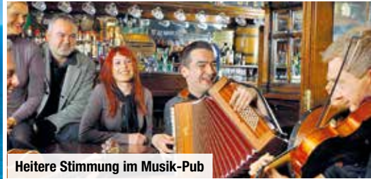
Heitere Stimmung im Musik-Pub