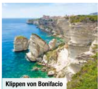
Klippen von Bonifacio