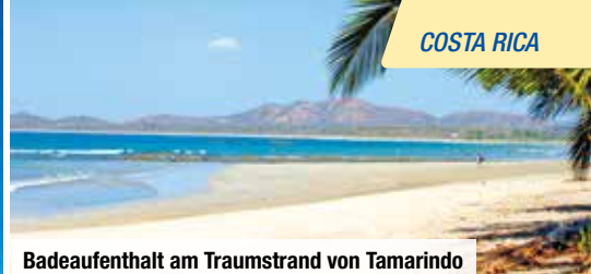
Badeaufenthalt am Traumstrand von Tamarindo

Reisegruppe mit max. 24 Personen u.a. inkl. Vulkan Poás, Tortuguero-Nationalpark & Hängebrücken-Wanderung