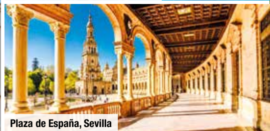
Plaza de España, Sevilla