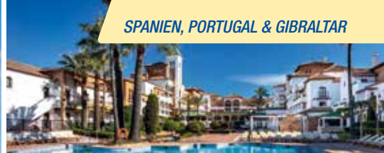
4-Sterne-Hotel Barceló Isla Canela