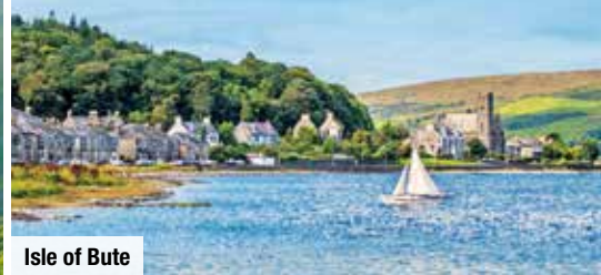
Isle of Bute