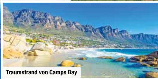
Traumstrand von Camps Bay