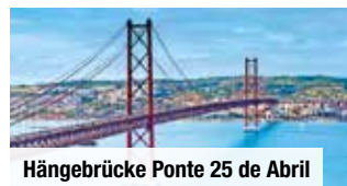
Hängebrücke Ponte 25 de Abril

Zug zum Flug: Hin- und Rückfahrt ab allen deutschen Bahnhöfen, 2. Klasse € 79 p. P.