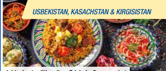
Inklusive traditionellem Erlebnis-Genusspaket