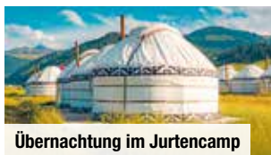
Übernachtung im Jurtencamp