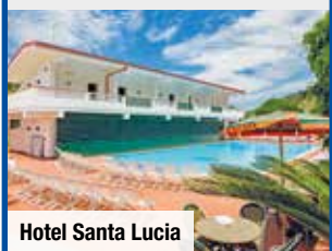
Hotel Santa Lucia