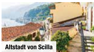
Altstadt von Scilla