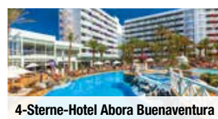
4-Sterne-Hotel Abora Buenaventura

Ein erholsamer Strandurlaub im 4-Sterne-Hotel mit Halbpension Plus und 18 wohltuenden Premium-Kuranwendungen – das ist (K)urlaub à la trendtours auf Gran Canaria. Bei einer Besichtigung entdecken Sie die bunte Inselhauptstadt Las Palmas und können anschließend noch flanieren. Dieses (K)urlaubs-Erlebnis lässt keine Wünsche offen!