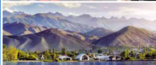
Übernachtung im Jurtencamp am Yssykköl-See