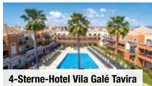
4-Sterne-Hotel Vila Galé Tavira