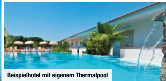
Beispielhotel mit eigenem Thermalpool