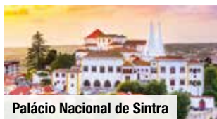
Palácio Nacional de Sintra

Mindestteilnehmerzahl: 36 Personen/Termin. Bei Nichterreichen kann die Reise bis 20 Tage vor Reisebeginn abgesagt werden.