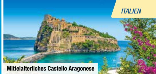
Mittelalterliches Castello Aragonese