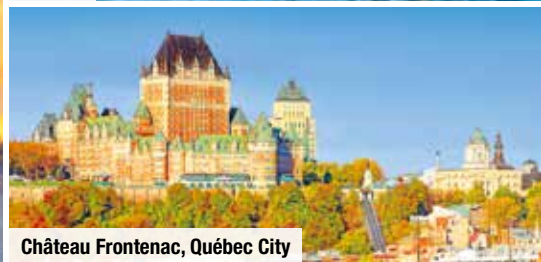
Château Frontenac, Québec City