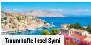
Traumhafte Insel Symi