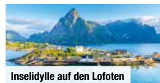
Inselidylle auf den Lofoten