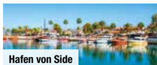
Hafen von Side

Mindestteilnehmerzahl: 36 Personen/Termin. Bei Nichterreichen kann die Reise bis 20 Tage vor Reisebeginn abgesagt werden.