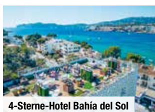
4-Sterne-Hotel Bahía del Sol