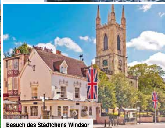
Besuch des Städtchens Windsor