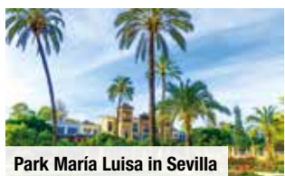
Park Maria Luisa in Sevilla

Tag 2: Ganztägiger Ausflug nach Sevilla , in die malerische Hauptstadt Andalusiens und eine der schönsten Städte Spaniens.