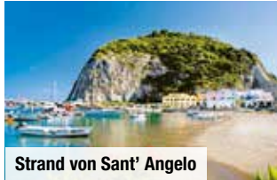
Strand von Sant' Angelo

Tag 2: Erholung auf der grünen Insel Ischia.