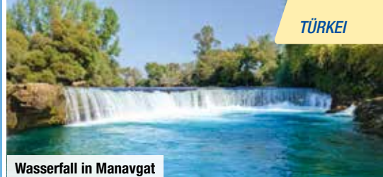
Wasserfall in Manavgat

Zug zum Flug: Hin- und Rückfahrt ab allen deutschen Bahnhöfen, 2. Klasse € 79 p. P.