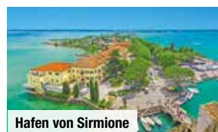
Hafen von Sirmione

Tag 2: Freizeit oder ein vor Ort zubuchbarer Ausflug nach Riva del Garda mit Schifffahrt nach Limone & Malcesine, danach Weinverkostung.