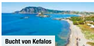
Bucht von Kefalos