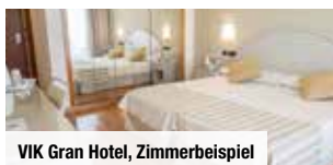
VIK Gran Hotel, Zimmerbeispiel