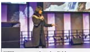
Willkommensabend mit Livegesang

Tag 3: Faszinierende Naturerlebnisse bieten Ihnen heute der Thingvellir-