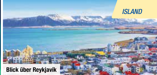
Blick über Reykjavík