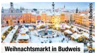
Weihnachtsmarkt in Budweis