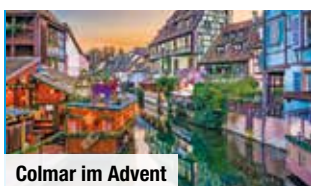
Colmar im Advent