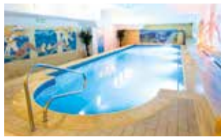
Hallenbad im 4-Sterne-Sanatorium