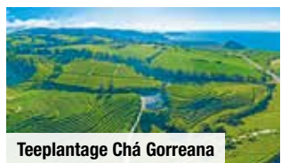
Teepflanzung Chá Gorreana

Tag 5: Ganztagesausflug ins paradiesische Vulkantal von Furnas und Besuch des botanischen Gartens