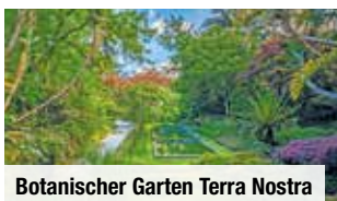
Botanischer Garten Terra Nostra

Zug zum Flug: Hin- & Rückfahrt von und zu allen deutschen Bahnhöfen, 2. Klasse € 79 p.P.