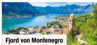
Fjord von Montenegro

Tag 4: Genießen Sie Freizeit oder entdecken Sie auf einem optionalen Ganztagesausflug u. a. die Hafenstadt Bar inkl. der Ruinenstadt Stari Bar