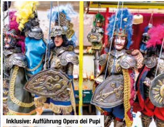
Inklusive: Aufführung Opera dei Pupi