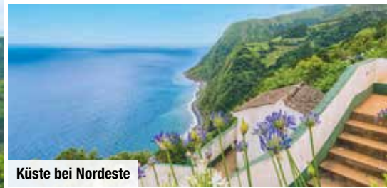
Küste bei Nordeste