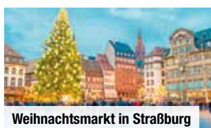
Weihnachtsmarkt in Straßburg

Für Alleinreisende : Einzelzimmer (+ € 35 p. N.) verfügbar. | Dreierbelegung ohne Aufpreis verfügbar. | Mindestteilnehmerzahl : 36 Personen/Termin. Bei Nichterreichen kann die Reise bis 30 Tage vor Reisebeginn abgesagt werden. | Nicht inklusive : Die Kurtaxe in Oberharmersbach von ca. € 1,05-3,50 pro Person und Nacht ist vor Ort im Hotel zu entrichten (Stand: Mai 2026).