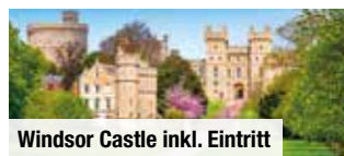
Windsor Castle inkl. Eintritt