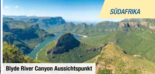
Blyde River Canyon Aussichtspunkt

✓ Bestes Preis-Leistungs-Verhältnis ✓ Intensive Erlebnisse durch die kleine Gruppe