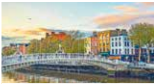
Stadtrundfahrt in Dublin inklusive