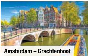
Amsterdam – Grachtenboot