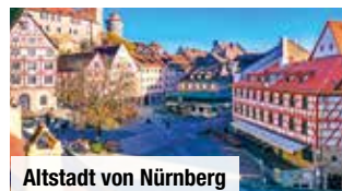
Altstadt von Nürnberg