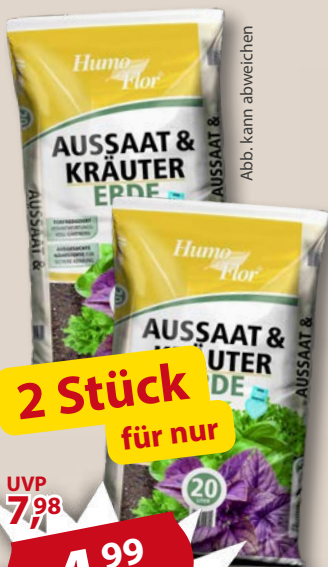
Abb. kann abweichen

20 Liter , für die Anzucht von Blumen- und Gemüsejungpflanzen, schwach gedüngt, Art. 180010056