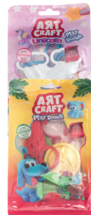
Modellierton mit Accessoires In 2 Ausführungen 1 99