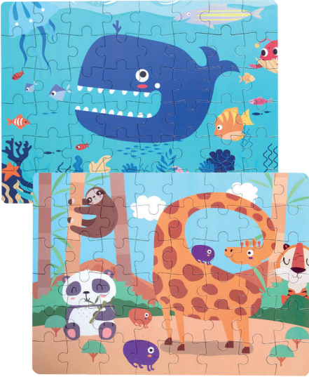
Puzzle 48 Teile