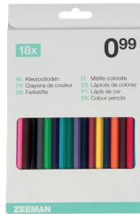
Buntstifte 18 Stück 0 99