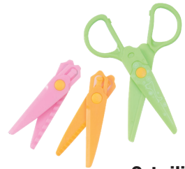
Bastelschere 13 cm. In 2 Ausführungen. 3-teilig 0 99