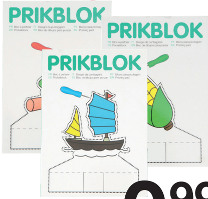
Prickelblock 15 x 21 cm. In 3 Ausführungen.