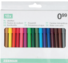
Filzstifte 18 Stück 0 99