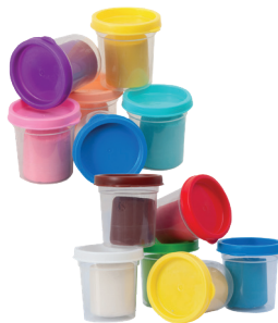
Modellierton 6 x 50 g 6 Töpfchen 1 79