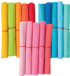
Filz 17 x 17 cm 5 Stück 0 79