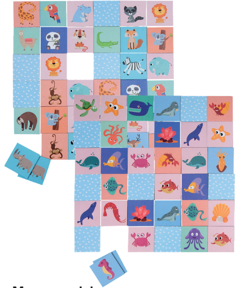
Memoryspiel 36 Teile