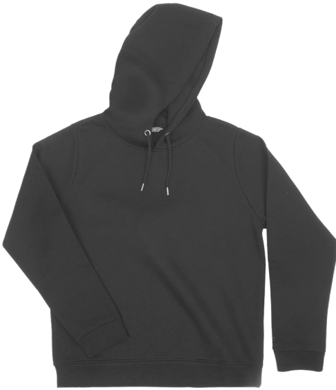
Damensweater Größe 36-48. Polyester/Baumwolle