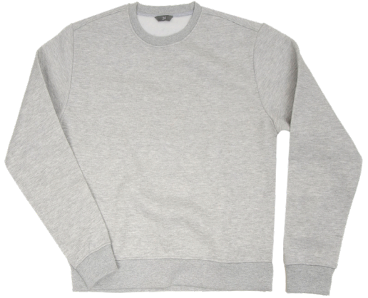
Damensweater Größe 36-48 Polyester/Baumwolle