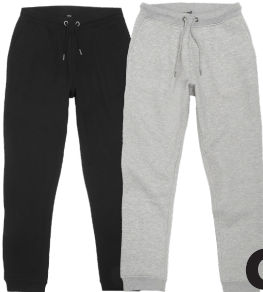
Damen-Jogginghose Größe 36-48 Polyester/Baumwolle

Entdecke auch du sie. Und wie immer zum kleinstmöglichen Preis.