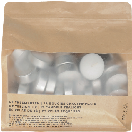
Teelichter 4 Stunden Brenndauer Aluminium/Paraffinwachs