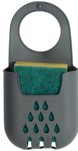
Topfreinigerhalter mit Topfreiniger Kunststoff/Viskose Demnächst erhältlich