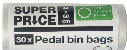
Mülleimerbeutel 20 l

Entdecke auch du sie. Und wie immer zum kleinstmöglichen Preis.