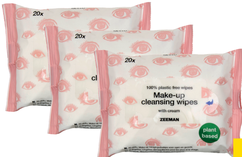
Make-up Reinigungstücher 20 Stück. 0,89