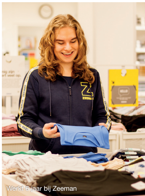
Werkt 6 jaar bij Zeeman

„Diesen Artikel verkaufen wir das ganze Jahr hindurch. Dieses Unterhemd wird oft gelobt, denn es ist bequem und läuft nicht ein. Die Basisfarben sind begehrt und die übrigen Farben wechseln je nach Saison. Die Kunden kommen wegen des Unterhemds gerne zu uns und kombinieren es oft mit Unterhosen und Shorts.“