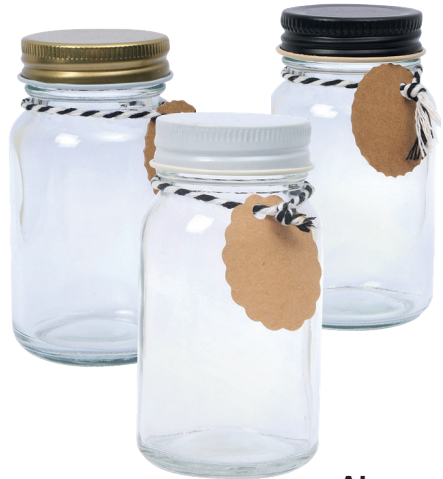
Vorratsglas 100 ml. 0.89, 400 ml. 1.39, 700 ml. 2.19 Glas mit Metallverschluss