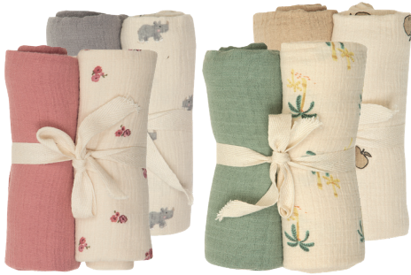
Mullwindel 60 x 60 cm. 100% Baumwolle