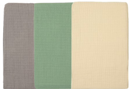
Spannbezug für Wickelaufgabe 74 x 45 x 17 cm. 100% Baumwolle