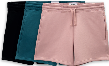
#Basicz Joggingshorts Größe S-XXL 100% Baumwolle