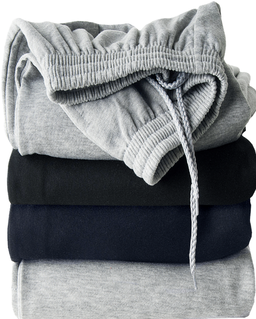
Herren-Jogginghose Größe S-XXL Polyester/Baumwolle