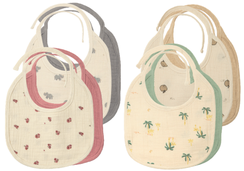
Baby-Lätzchen Einheitsgröße 100% Baumwolle