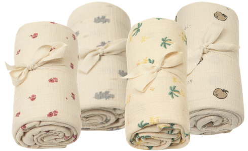
Mullwindel 110 x 110 cm. 100% Baumwolle