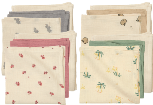
Baby-Gesichtstücher 30 x 30 cm. 100% Baumwolle