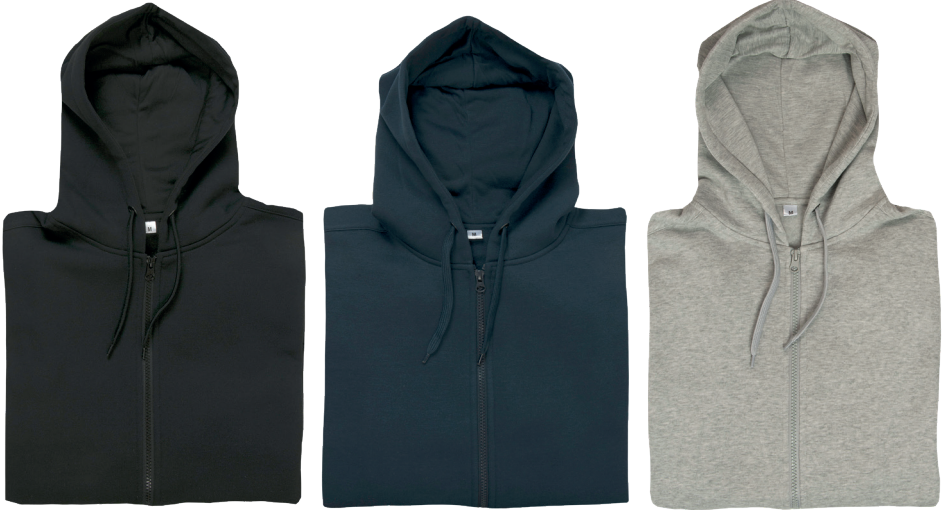
Kapuzenjacke Größe S-XXL Polyester/Baumwolle