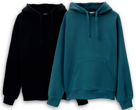
#BasicZ Kapuzensweater Größe S-XXL 100% Baumwolle