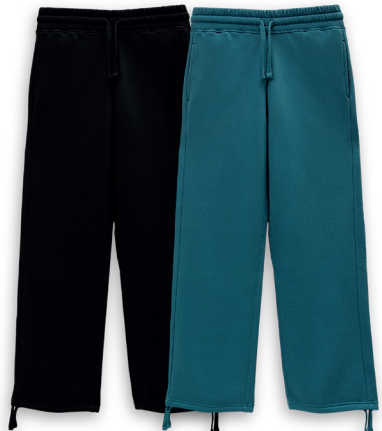
#BasicZ Jogginghose Größe S-XXL 100% Baumwolle