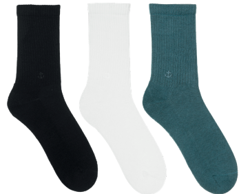
#BasicZ Socken Größe 35-42 Baumwolle/Polyester/Elastan