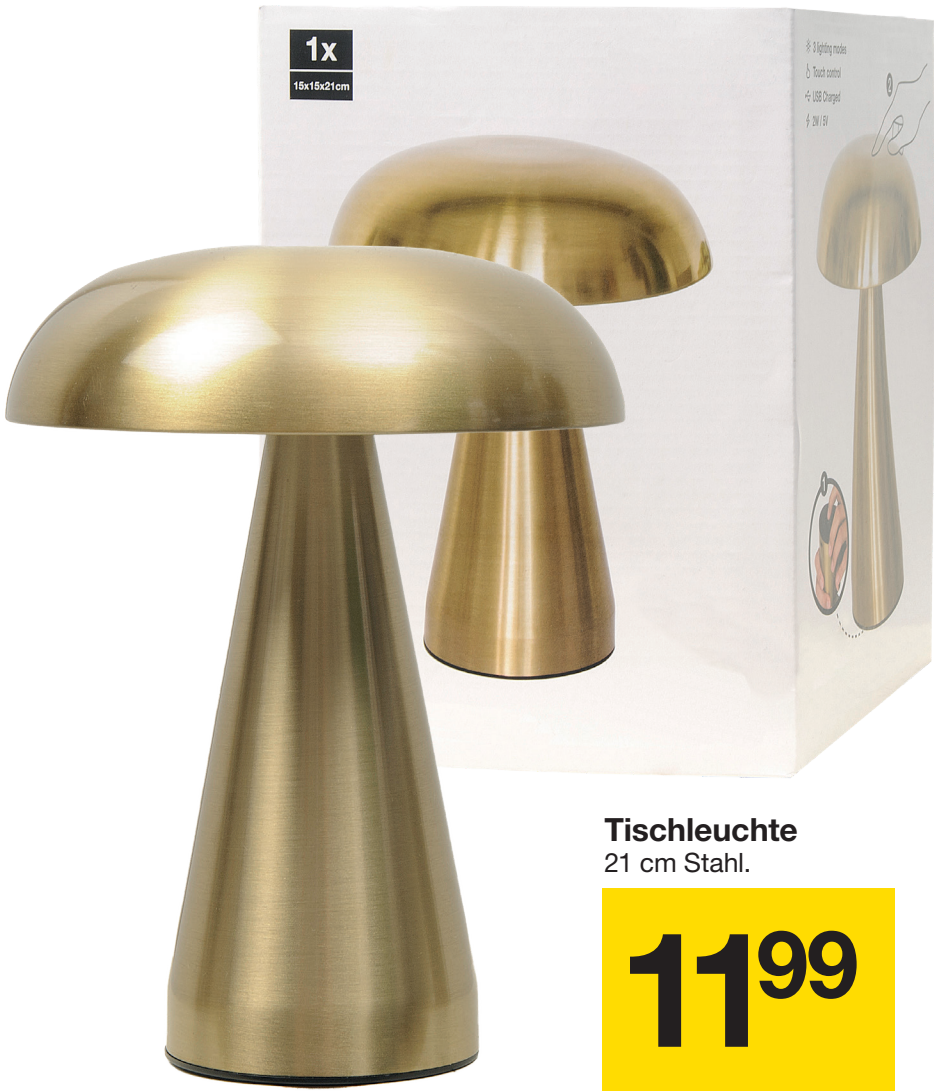
Tischleuchte 21 cm Stahl.