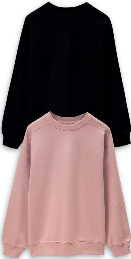
#BasicZ Sweater Größe S-XXL 100% Baumwolle