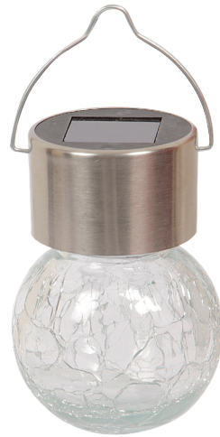
Solarleuchte 9 x 6 cm Rostfreier Stahl/Glas