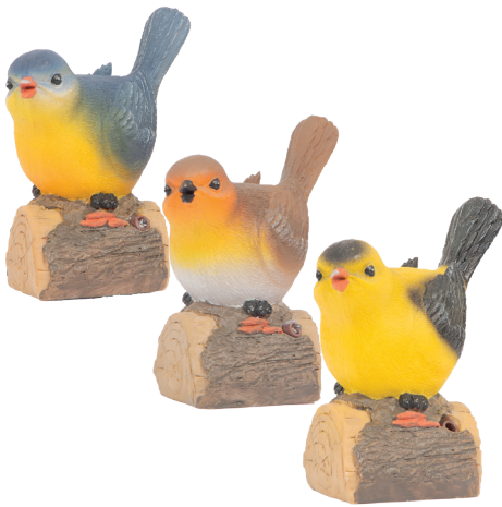
Solarvogel mit Sound 10,5 x 9 x 6 cm. Verschiedene Sorten. Kunststoff