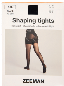
Shaping Strumpfhose 40 Den. Größe S-XXL. Polyamid/Elasthan In der Farbe Schwarz