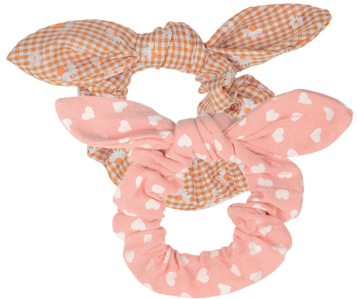
Gummi mit Schleifen Polyester/Gummi