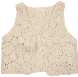
Weste Größe 92-164 / 1,5-14J. 95 % Baumwolle/5 % Elasthan. 8,99