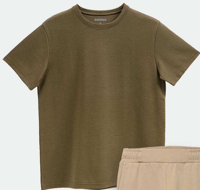
Herren-T-Shirt Größe S-XXL Baumwolle/Polyester