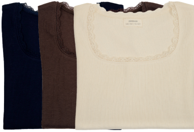
T-Shirt Größe 134-164 / 8-14J 100 % Baumwolle. 4,49