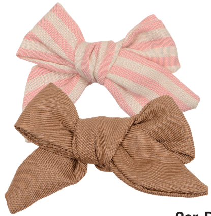
Haarspange mit Schleife Polyester/Metall