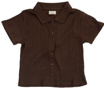
Top Größe 134-164 / 8-14J. Polyester/Baumwolle. 5,99