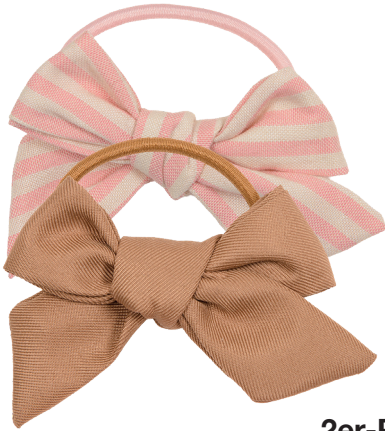
Gummi mit Schleifen Polyester/Gummi