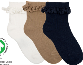
Socken Größe 23-39. Bio-Baumwolle/Polyester/ Elasthan. 3 Paar. 3,99 1,33 €/Paar