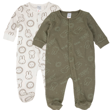
Babystrampler Größe 50-68 / 0-6M 100 % Baumwolle