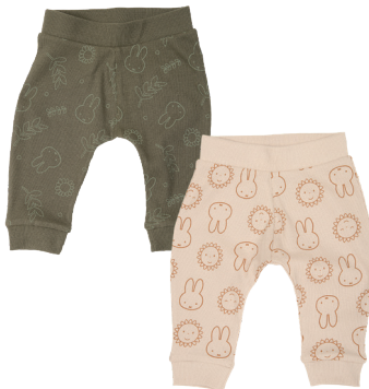
Babyleggings Größe 50-92 / 0M-2Y 100 % Baumwolle