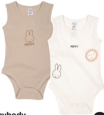
Babybody Größe 50-86 / 0-18M 95 % Baumwolle/5 % Elasthan