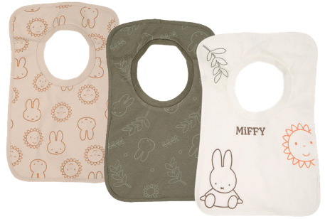
Lätzchen Einheitsgröße 100 % Baumwolle