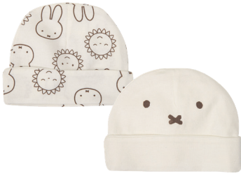
Babymütze Einheitsgröße 100 % Baumwolle