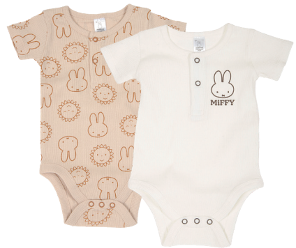
Babybody Größe 50-86 / 0-18M 95 % Baumwolle/5 % Elasthan