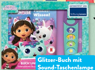
Glitzer-Buch mit Sound-Taschenlampe

Abwechslungsreiche Übungen und Aufgaben für Vor- und Grundschule