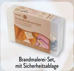
Brandmalerei-Set, mit Sicherheitsablage