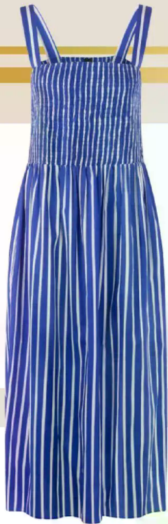
MARC CAIN Kleid 249 €