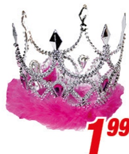
Prinzessinnen-Krone mit Plüsch