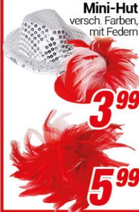
Mini-Hut versch. Farben, mit Federn