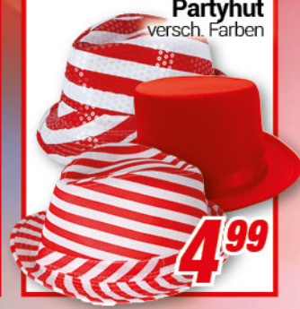
Partyhut versch. Farben