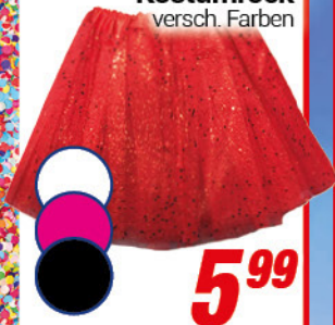
Kostümrock versch. Farben