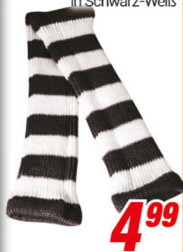
Ringelstulpen in Schwarz-Weiß