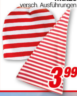
Mütze versch. Ausführungen