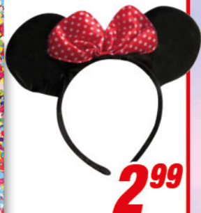
Haarreif MINNIE MOUSE