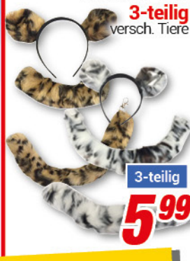
Zubehör-Set 3-teilig versch. Tiere