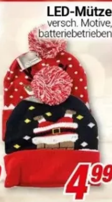
LED-Mütze versch. Motive, batteriebetrieben