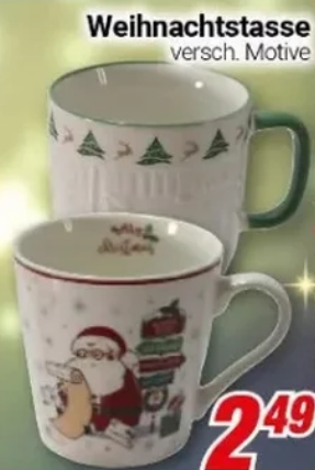
Weihnachtstasse versch. Motive