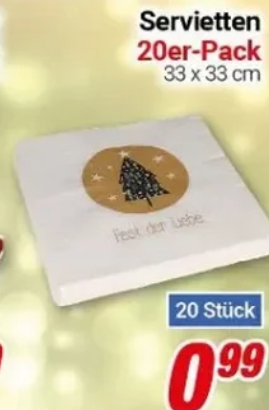
Servietten 20er-Pack 33 x 33 cm