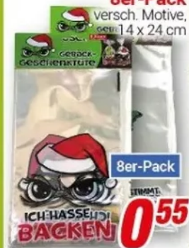
Gebäcktüte 8er-Pack versch. Motive, Größe 14 x 24 cm