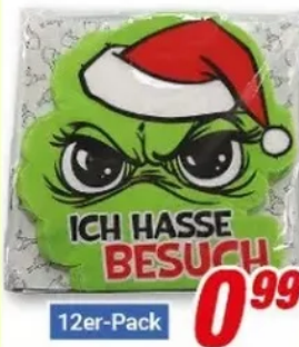
Servietten 12er-Pack 33 x 33 cm