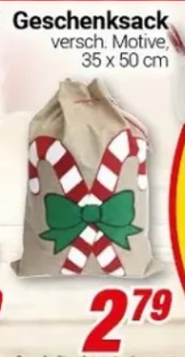
Geschenksack versch. Motive, 35 x 50 cm