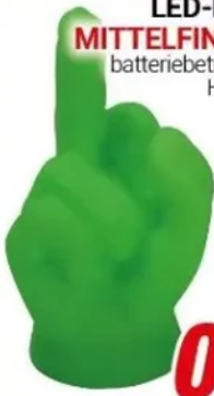
LED-Licht MITTELFINGER batteriebetrieben, H 9 cm

HÄSSLICH KUCHE Ø 8 cm 1 Kugel 1,99 Ø 6 cm 6 Kugeln 3,99 Ø 8 cm 6 Kugeln 5,99 ab 1 99