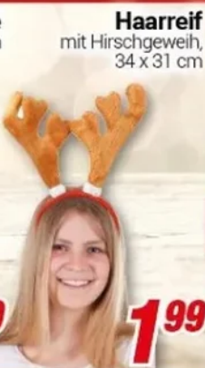
Haarreif mit Hirschgeweih, 34 x 31 cm