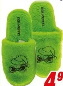
Pantoffeln versch. Ausführungen