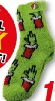
Kuschelsocken versch. Ausführungen