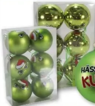
Baumkugeln versch. Ausführungen

HÄSSLICH KUCHE Ø 8 cm 1 Kugel 1,99 Ø 6 cm 6 Kugeln 3,99 Ø 8 cm 6 Kugeln 5,99 ab 1 99