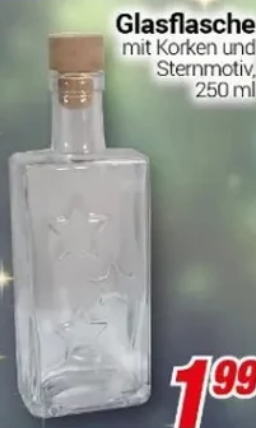
Glasflasche mit Korken und Sternmotiv, 250 ml