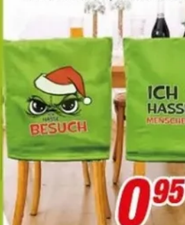
Stuhlhusse versch. Motive, 48 x 64 cm