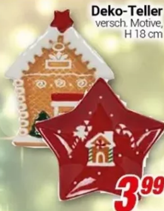
Deko-Teller versch. Motive, H 18 cm