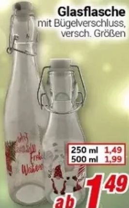
Glasflasche mit Bügelverschluss, versch. Größen