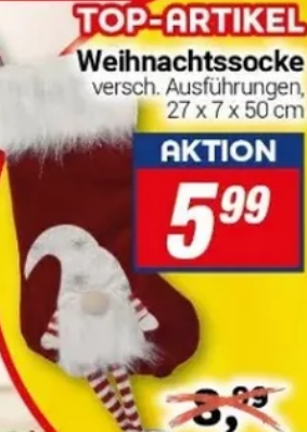
TOP-ARTIKEL Weihnachtssocke versch. Ausführungen, 27 x 7 x 50 cm