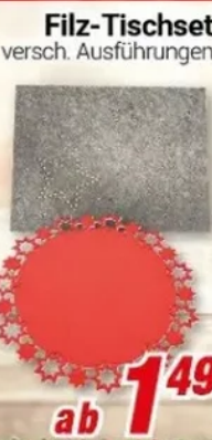
Filz-Tischset versch. Ausführungen