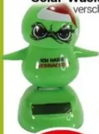
Solar-Wackelfigur versch. Motive, H 9 cm