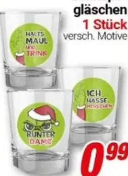
Schnaps-gläschen 1 Stück versch. Motive