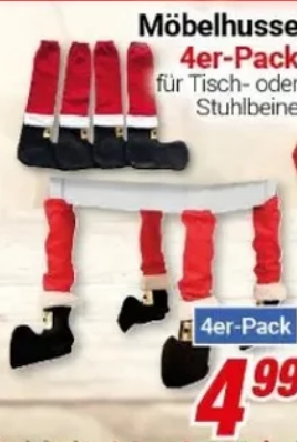
Möbelhuse 4er-Pack für Tisch- oder Stuhlbeine