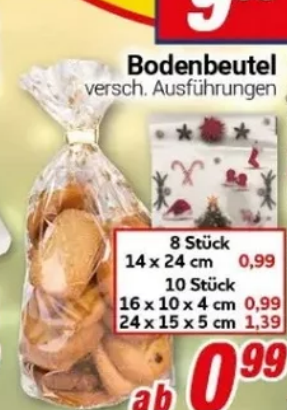
Bodenbeutel versch. Ausführungen

8 Stück 14 x 24 cm 0,99 10 Stück 16 x 10 x 4 cm 0,99 24 x 15 x 5 cm 1,39