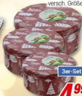
Keksdosen 3er-Set versch. Größen