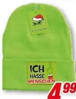
Mütze versch. Motive