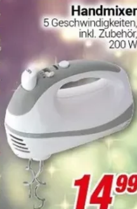
Handmixer 5 Geschwindigkeiten, inkl. Zubehör, 200 W