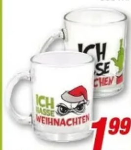
Tasse/Trinkglas versch. Motive, 350 ml