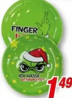
Gebäckteller versch. Motive, Ø 26 cm