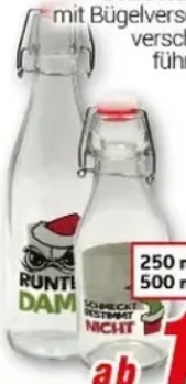
Glasflasche mit Bügelverschluss, versch. Ausführungen