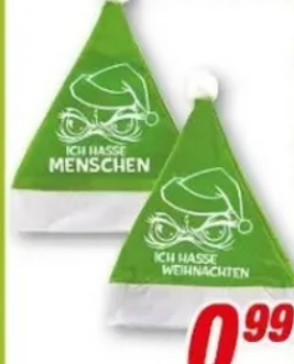
Plüschmütze versch. Motive