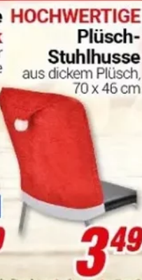
HOCHWERTIGE Plüsch- Stuhlhuse aus dickem Plüsch, 70 x 46 cm