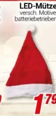
LED-Mütze versch. Motive, batteriebetrieben