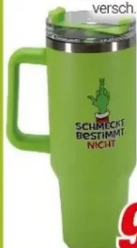
Thermobecher versch. Motive, 1,2l