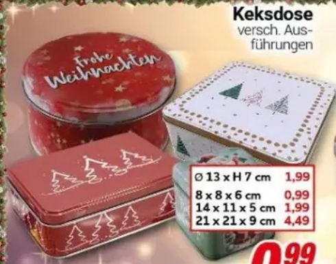
Keksdose versch. Aus- führungen

Ø 13 x H 7 cm 1,99 8 x 8 x 6 cm 0,99 14 x 11 x 5 cm 1,99 21 x 21 x 9 cm 4,49