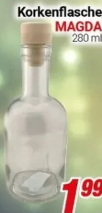
Korkenflasche MAGDA 280 ml