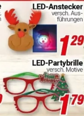
LED-Anstecker versch. Aus- führungen