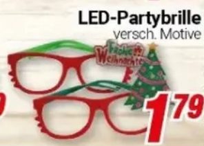
LED-Partybrille versch. Motive