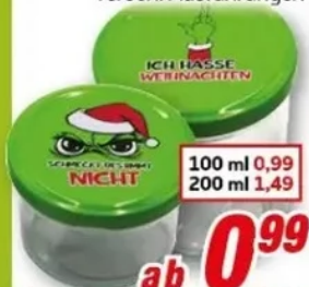
Einmachglas versch. Ausführungen