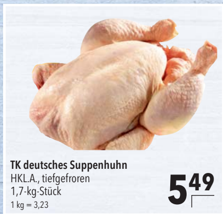
TK deutsches Suppenhuhn HKL.A., tiefgefroren 1,7-kg-Stück 1 kg = 3,23