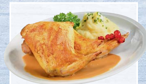
TK Kaninchenkeule 4 - 5 Stück à ca. 200 g, tiefgefroren 1 kg