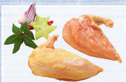
TK französisches Maishähnchen-Suprême Maishähnchen-Brustfilet mit Haut und mit Flügelknochen, ca. 230/300 g, tiefgefroren 1 kg