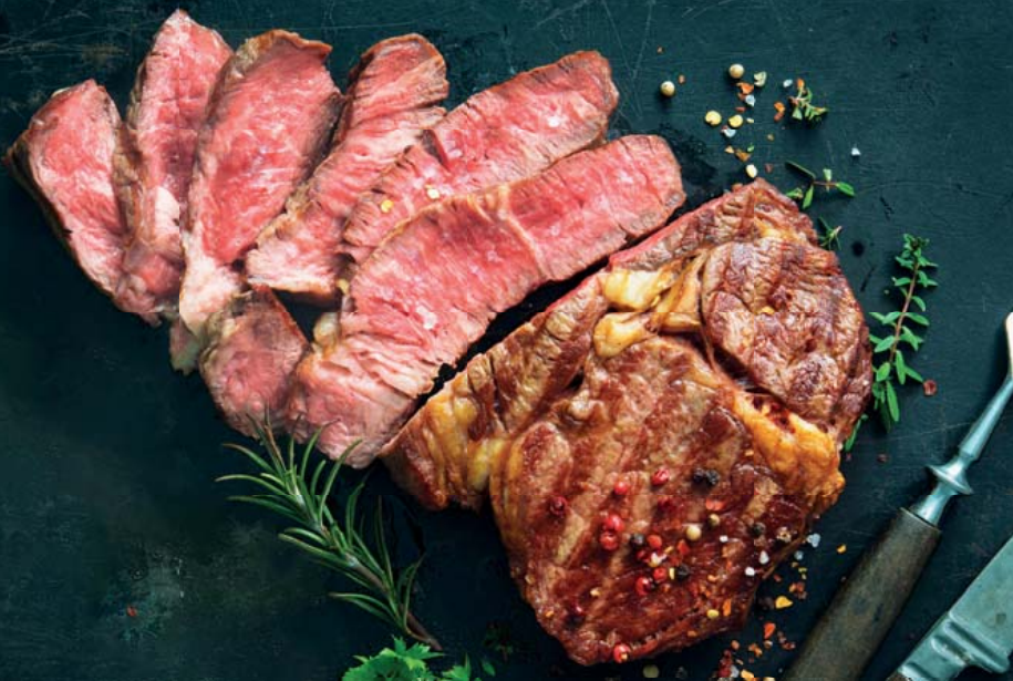
TK EU Rinderfilet 3/5 lb ohne Kette, ca. 1,8 kg, tiefgefroren 1 kg