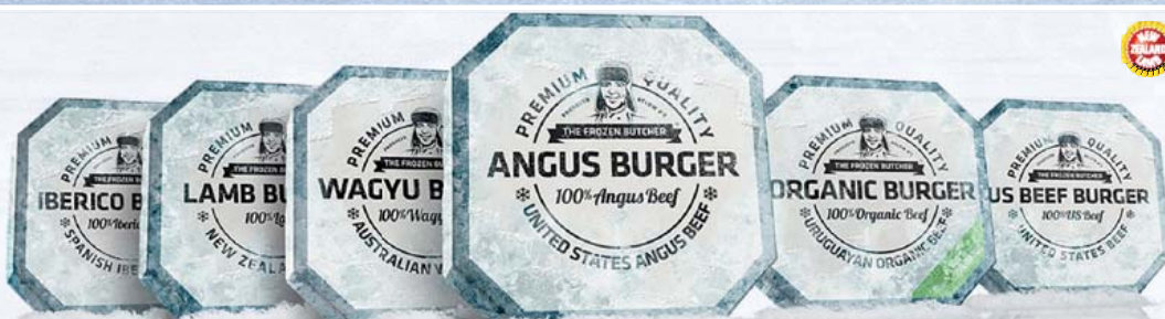
BIO TK Bio Uruguay Beef Burger 2 Stück à 125 g 250-g-Packung 1 kg = 17,96