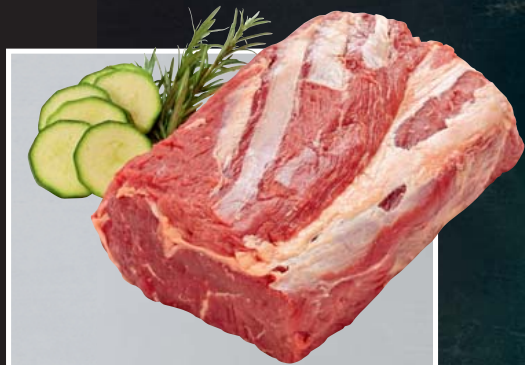
TK Paraguay Entrecôte ca. 1-kg-Stück, tiefgefroren 1 kg