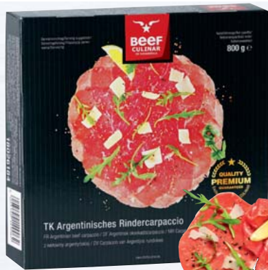
TK Argentinisches Carpaccio 2 x 5 x 80 g verpackt, tiefgefroren 800-g-Packung 1 kg = 21,99