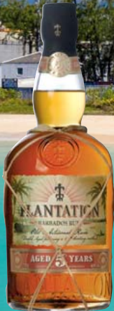
Plantation Barbados Rum, 5 Jahre 40% Vol., Vanille, Honig, Kokos, Banane, Trockenfrüchte 0,7-l-Flasche 1 l = 35,70 24,99