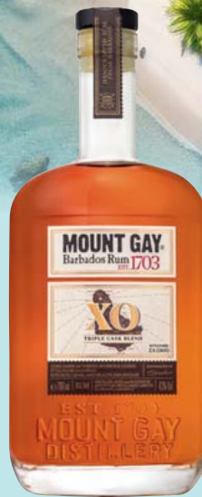
Mount Gay XO Triple Cask Blend 43% Vol. würzige Eichennoten, Karamell, toastige Aromen 0,7-l-Flasche, 1l = 67,13 46,99