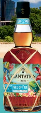
Plantation Isle of Fiji 40% Vol., Birne, Apfel, Banane, Stachelbeere 0,7-l-Flasche 1 l = 38,56 26,99