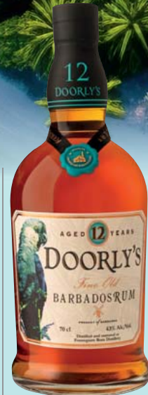
Doorly's Fine Old Rum, 12 Jahre 43% Vol. Schokolade, Toffee und Eichenholz 0,7-l-Flasche 1l = 69,99 48,99