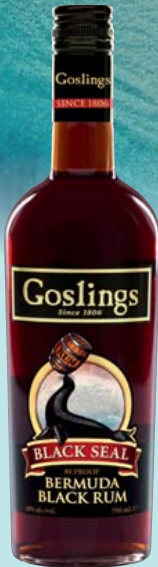
Goslings Bermuda Black Rum Black Seal, 40% Vol. Sahnebonbons, Vanille und Karamell 0,7-l-Flasche 1l = 32,84 22,99