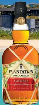
Plantation Xaymaca Special Dry Rum 43% Vol., Banane, Trockenfrüchte, Kokos 0,7-l-Flasche 1 l = 37,13 25,99