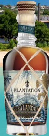
Plantation Sealander Rum 40% Vol., rote Früchte, Holz, Kokosnuss, gebrannte Mandeln 0,7-l-Flasche 1 l = 38,56 26,99