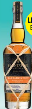
Plantation Barbados VSOR, Single Cask Edition 2022 44,9% Vol., geröstete Kastanie, Vanille, Zimt, Muskatnuss 0,7-l-Flasche 1 l = 64,27 44,99