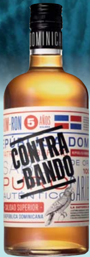
Ron Contrabando Rum, 5 Jahre 38% Vol., Vanille, exotische Früchte, Kokos 0,7-l-Flasche 1l = 28,56 19,99