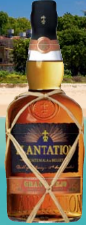
Plantation Guatemala & Belize Gran Anejo 42% Vol., Cognac, Nüsse, Lakritz, Holz 0,7-l-Flasche 1 l = 41,41 28,99