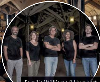
Familie Williams & Humbert