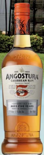
Angostura Gold Rum, 5 Jahre oder Dark Rum, 7 Jahre 40% Vol. Angostura Gold: Schokolade, Gewürze, Apfel Angostura Dark: Karamell, Melasse, Kakao je 0,7-l-Flasche 1l = 35,70 24,99

Die Destillerie Angostura ist einer der führenden Rumproduzenten der Karibik. Viele Produkte des in Trinidad ansässigen und in über 150 Länder exportierenden Unternehmens existieren bereits seit Generationen. Mit der Jahrhundertwende wurde das Geschäft mit Angostura Bitter um das Rumsortiment erweitert. Zunächst wurde der Rum von anderen Produzenten abgefüllt, bis 1945 eine eigene Brennerei eröffnet wurde. Fachleute bezeichnen das Angostura Rumangebot als das weltweit am häufigsten prämierte Sortiment.