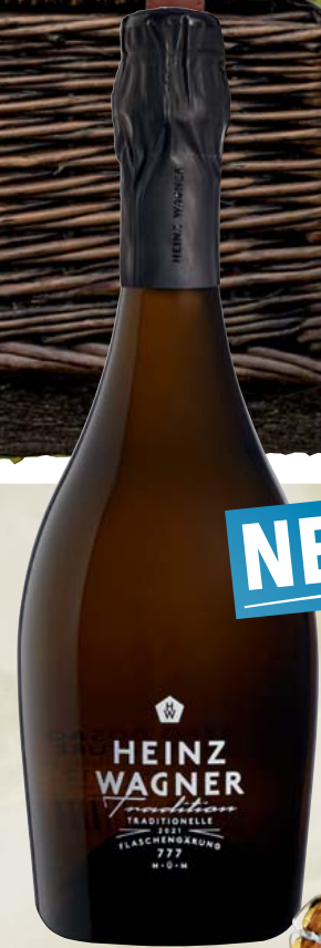
Deutschland-Baden Heinz Wagner Tradition Sekt, Brut Nature 0,7-l-Flasche 1l = 23,99 17,99