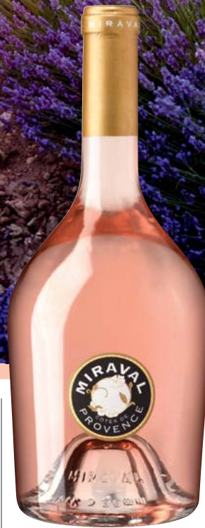
Frankreich-Provence Pitt & Perrin Miraval Rosé AOP trocken Aromen von Erdbeeren, Himbeeren und weißen Blüten, erfrischende Fruchtsäure 0,75-l-Flasche 11 = 26,65 19,99