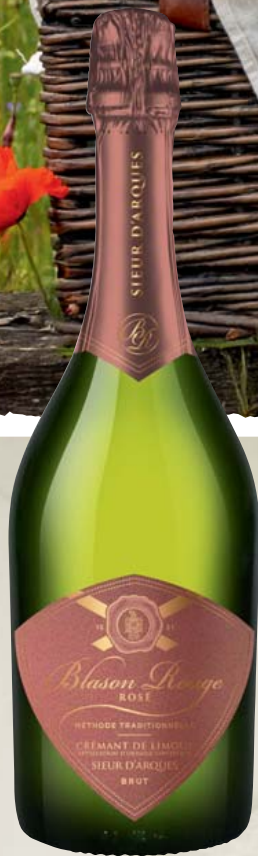
Blason Rouge Rosé Crémant de Limoux AOP, Brut 0,75-l-Flasche 1l = 17,32 12,99