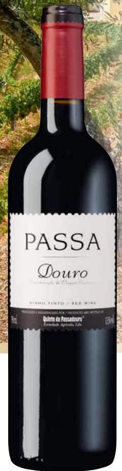
Portugal-Douro Quinta do Passadouro Passa Tinto DOP trocken

Aromen von reifen Kirschen und Brombeeren, zarte, weiche Würze