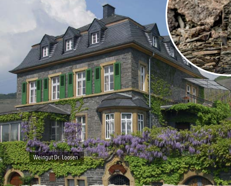
Weingut Dr. Loosen

Das Spektrum reicht von grünen Aromen wie Apfel und Birne über Zitrusnoten bis zu Pfirsich und Aprikose. Je nach Boden gesellen sich mineralisch-würzige Töne dazu. Das hohe Alterungspotential ist ein weiteres Kennzeichen der Rebsorte. Auch hierbei spielt die Säure erneut eine entscheidende Rolle.