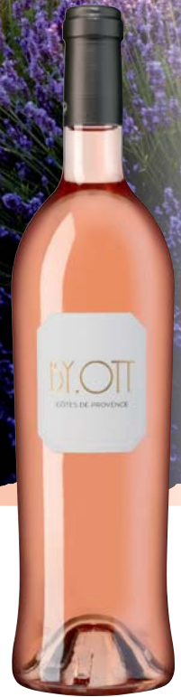
Frankreich-Provence Domaines Ott By.Ott Rosé AOP trocken Aromen von roten Beeren, leicht würzige Note 0,75-l-Flasche 11 = 26,65 19,99