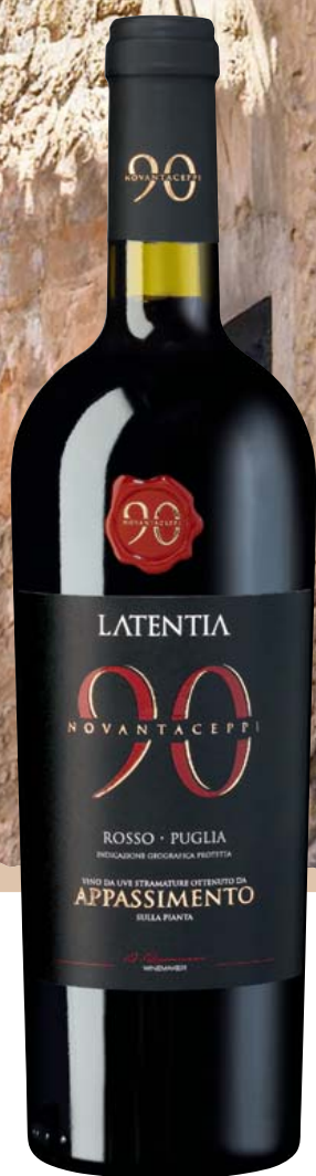
Italien-Apulien Latentia Winery Novantaceppi Appassimento Rosso IGP halbtrocken Noten von getrockneten Früchten, Bitterschokolade und Gewürzen, gut eingebundene Restsüße 0,75-l-Flasche 11 = 7,99