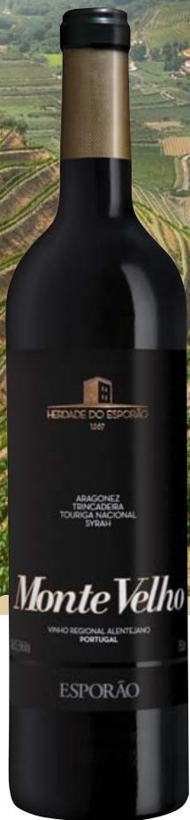
Portugal-Alentejo Finagra S.A. Lissabon Monte Velho Tinto DOP trocken

Lange Zeit standen Weine aus dem Weinland Portugal in der zweiten Reihe. Längst aber machen die portugiesischen Winzer Boden gut. Das Weinland Portugal hat in den vergangenen zehn, zwanzig Jahren einen Entwicklungssprung getan wie kein zweites in Europa. Und das zum großen Teil auch dank Europa. Inzwischen verbindet man mit dem Land nicht nur Klassiker wie Portwein und Madeira. Einigen Weinregionen ist es gelungen, mit gewachsenem Qualitätsbewusstsein und neuer Technik ihre traditionellen Stärken auf ein besseres Niveau zu heben. Heute überzeugen die Weine mit einer überraschenden Frische und Eleganz und lassen die alte Schwerfälligkeit weit hinter sich.