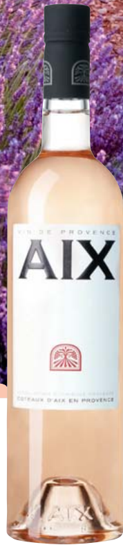
Frankreich-Provence Maison Saint Aix AIX Rosé trocken Noten von roten Früchten, vollmundig und mit aromatischer Tiefe 0,75-l-Flasche 11 = 21,32 15,99