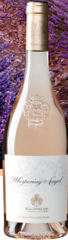
Frankreich-Provence Château D'Esclans Whispering Angel AOP trocken Bouquet von roten Früchten, typische Provence Würze 0,75-l-Flasche 11 = 26,65 19,99