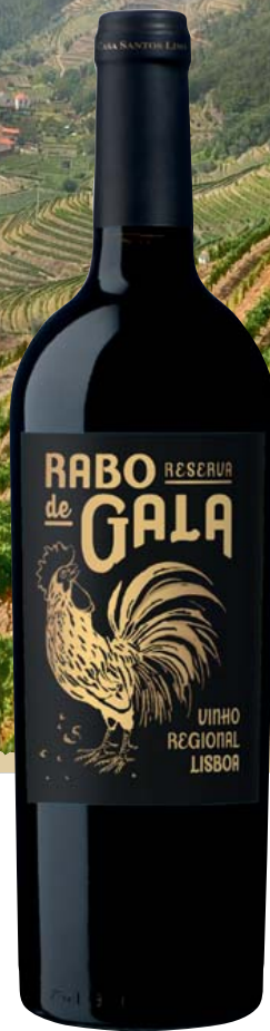
Portugal-Lissabon Casa Santos Lima Rabo de Gala Reserva Vinho Regional Lisboa trocken

Aromen von wilden Früchten mit Würz- note, gut strukturiert mit ausbalancierter und eleganter Tanninstruktur