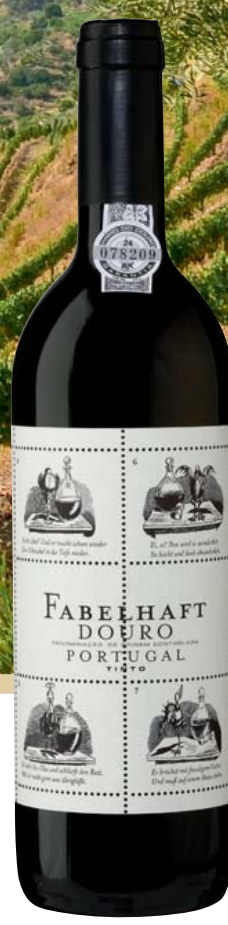
Portugal-Douro Niepoort Vinhos Fabelhaft Tinto DOP trocken

Aromen nach dunklen und roten Beeren, jung mit ausbalancierter Säure und runden Tanninen