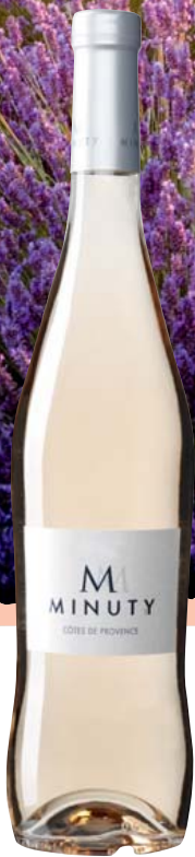
Frankreich-Provence Minuty Cuvée M Rosé Minuty AOP trocken Aromen von roten Beeren, wie Erdbeere oder Johannisbeere, frisch mit ausgewogener Säure 0,75-l-Flasche 11 = 18,65 13,99

Ein Roséwein aus der Provence ist in der Regel ein frischer, spritziger und fruchtbetonter Wein , der sich bestens als vielseitiger Essensbegleiter macht. Die typischen Vertreter bestehen meist aus einem Verschnitt von Grenache, Cinsault, Syrah und Mourvèdre. Aromatisch erinnern sie am ehesten an Erdbeeren, Wassermelone und Rosenblätter. Zudem überzeugen gute Exemplare durch eine schöne Mineralität und eine feine Salzigkeit im Abgang.