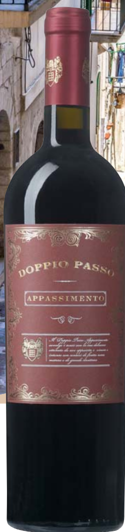
Italien-Apulien Doppio Passo Appassimento Primitivo Salento IGP lieblich Brombeere, Sauerkirsche und getoastetes Holz, samtige Textur 0,75-l-Flasche 11 = 11,99