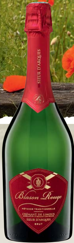
Frankreich-Languedoc Sieur d'Arques Blason Rouge Crémant de Limoux AOP, Brut 0,75-l-Flasche 1l = 17,32 12,99

Natürlich die Franzosen! Aber nicht die in der weltberühmten Champagne, sondern die in Limoux ! Dass wir heute Schaumweine genießen können, geht wohl auf einen Unfall zurück. In den Anfängen des Weinbaus gab es noch keine Filter, Sterilisation oder Vorschriften für die Hygiene bei der Weinbereitung. So ist es nicht verwunderlich, dass die eine oder andere Flasche Wein bei der Abfüllung mit der ihr eigenen Hefe aus der Gärung verunreinigt wurde. Dann passierte es und eine zweite Gärung auf der Flasche begann. Irgendwann hat man dann erkannt, dass das Ergebnis dieses Unfalls durchaus sehr schmackhaft sein kann – und begonnen, diesen Vorgang der zweiten Gärung bewusst und kontrolliert herbeizuführen.