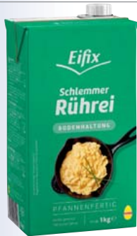
Eifix Schlemmer-Rührei Bodenhaltung hergestellt aus frischen Eiern aus Bodenhaltung, pasteurisiert, lecker vorgewürzt 1-kg-Packung