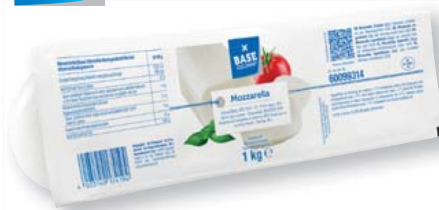
BASE CULINAR Mozzarella 45% Fett i.Tr., schnittfest, frischer, angenehmer Geschmack 1-kg-Packung