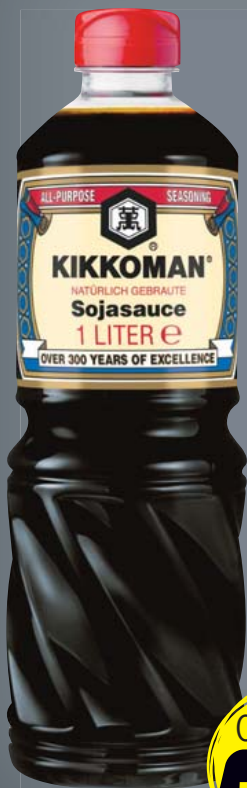
Kikkoman Soja-Sauce 1 l-Flasche