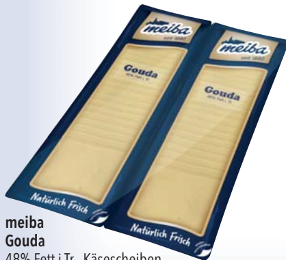
meiba Gouda 48% Fett i.Tr., Käsescheiben, gefächert 2 x 25 x 20-g-Packung