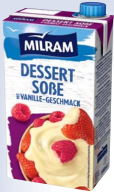
Milram Vanillesoße 10% Fett, ungekühlt haltbar 1-l-Packung