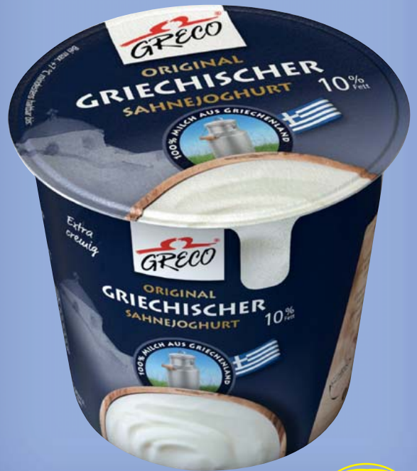
Greco Sahnejoghurt original griechischer Sahnejoghurt, 10% Fett 1-kg-Becher