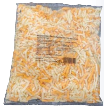
Mozzarella Cheddar Mix gerieben geriebener Käse aus Mozzarella 40% Fett i.Tr. und Cheddar 45% Fett i.Tr. 1-kg-Beutel