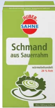
Huber H-Sauerrahm 24% Fett 1000-g-Packung