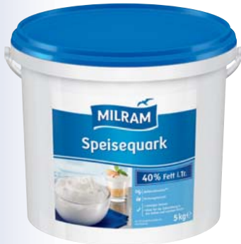
Milram Speisequark 40% Fett, gerührt 5-kg-Eimer 1 kg = 3,19