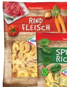
Steinhaus Tortelloni Frischnudeln gefüllt oder Gnocchi je 1-kg-Beutel