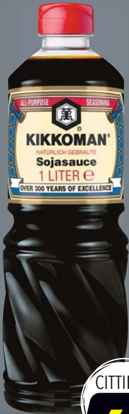
Kikkoman Soja-Sauce 1-l-Flasche