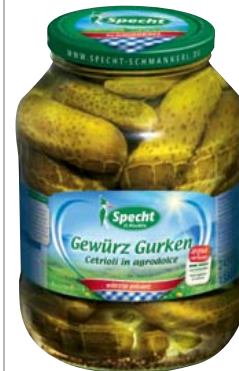
Specht Gewürzgurken ATG: 1380 g, knackig frische Specht Ge- würzgurken, mit feinen Kräutern und pikanten Gewürzen abgeschmeckt - zur Brotzeit, für Salate oder einfach zum Reinbeißen, handver- lesen 2650-ml-Glas 1 kg = 4,34