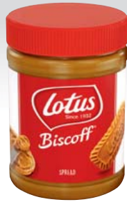
Lotus Biscoff Creme 1,6-kg-Glas 1 kg = 8,74