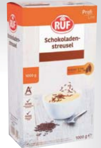
Ruf Schokoladen-Streusel 1-kg-Packung