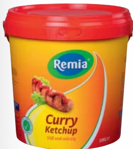
Remia Curryketchup ohne Konservierungsstoffe 10-kg-Eimer 1 kg = 1,79