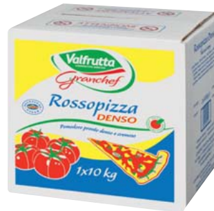
Gustodoro Pizza-Tomatenspulver fein gehackte Tomaten 10-kg-Bag in Box 1 kg = 1,20