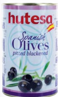
Oliven schwarz ohne Stein, ATG: 2000 g 4250-ml-Dose 1 kg = 4,50