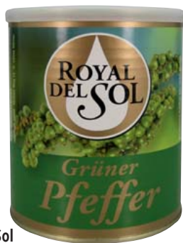
Royal del Sol Grüner Pfeffer in Lake ATG: 500 g 850-ml-Dose 1 kg = 7,98