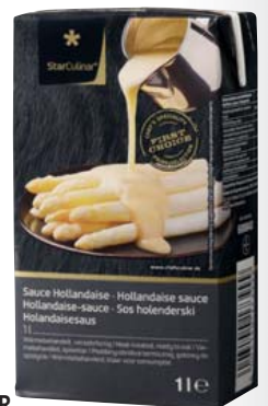
STAR CULINAR Sauce Hollandaise 1-l-Packung