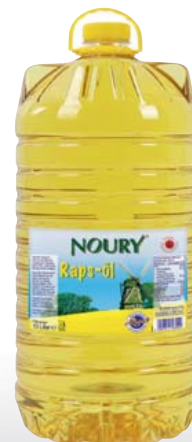
Rapsöl 10-l-Flasche 1 l = 1,25