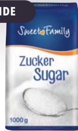
Sweet Family Zucker bei Abnahme von 10 x 1-kg-Packung 1 kg = 0,79