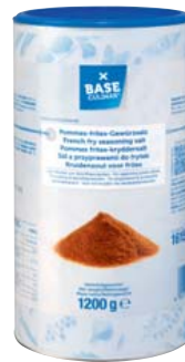
BASE CULINAR Pommes Frites Salz pikante Gewürzmischung abgestimmt für Pommes Frites 1,2-kg-Dose 1 kg = 4,16