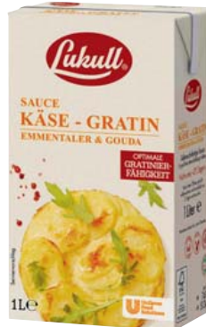
Lukull Käse-Gratin-Sauce 1-l-Packung