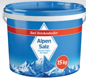
Bad Reichenhaller Alpen- oder Jodsalz je 15-kg-Eimer 1 kg = 0,67