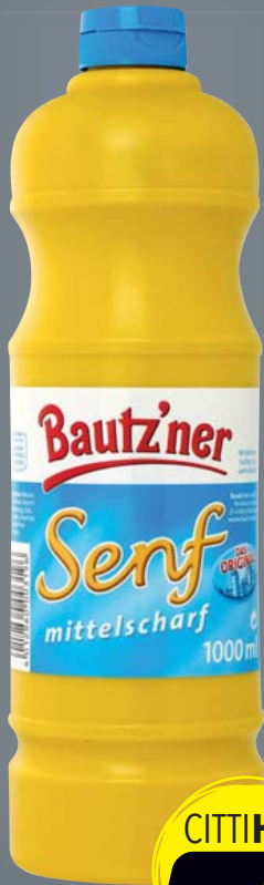
Bautzner Senf mittelscharf 1000-ml-Flasche