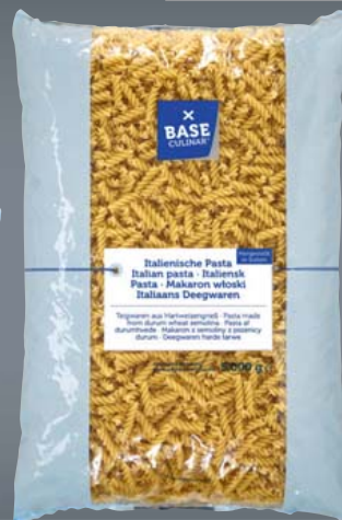
BASE CULINAR Italienische Teigwaren verschiedene Standardsorten je 5-kg-Beutel 1 kg = 1,00