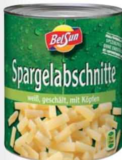
Spargelabschnitte mit Kopf, ATG: 1850 g 3100-ml-Dose 1 kg = 2,97