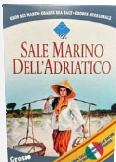
Sai Sali Sale Marino Italienisches Meersalz grob 1-kg-Packung