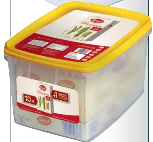
Lukull Sauce Hollandaise 10 x 1-l-Packung 11 = 4,19