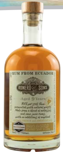
Romero & Sons Rum, 9 Jahre 44% Vol., Waldfrüchte, Pflaume, ein Hauch Eiche 0,7-l-Flasche 1 l = 52,84 36,99