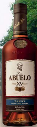
Ron Abuelo Añejo, 15 Jahre, Tawny Port Cask Finish 40% Vol., rote Früchte und Beeren, holzig 0,7-l-Flasche 1 l = 85,70 59,99