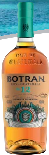
Ron Botran Reserva Superior, 12 Jahre 40% Vol., Vanille, Karamell, Kaffee, Nüsse, ein Hauch tropischer Früchte 0,7-l-Flasche 1 l = 38,56 26,99