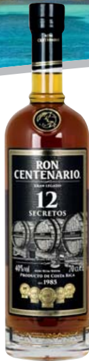
Ron Centenario Gran Legado, 12 Jahre 40% Vol., Karamell, Nüsse 0,7-l-Flasche 1 l = 42,84 29,99