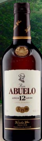
Ron Abuelo Añejo Gran Reserva, 12 Jahre 40% Vol., Karamell, Eichen- würze, Zitrusnote 0,7-l-Flasche 1 l = 42,84 29,99