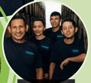
Team Ron Cihuatán