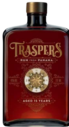
Traspers Panama Rum, 15 Jahre 40% Vol., Beeren, Butterkaramell, Toffee, Marzipan 0,7-l-Flasche 1 l = 49,99 34,99