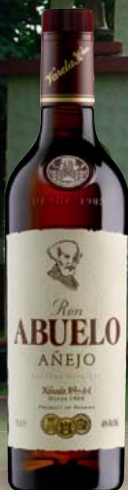
Ron Abuelo Añejo Reserva Especial 40% Vol., Zuckerrohrhonig, Vanillearomen, Muskatnuss 0,7-l-Flasche 1 l = 21,41 14,99