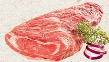
Frisches deutsches Wagyu Bürgermeisterstück 100 g