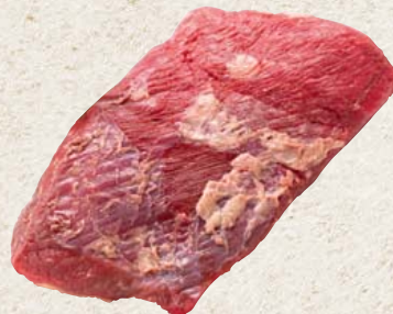
Frisches deutsches Wagyu Beef Brisket aus der Rinderbrust 100 g