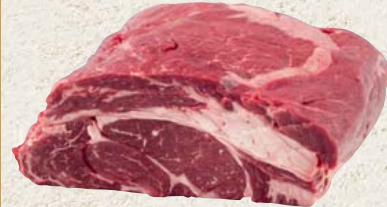
Frische deutsche Wagyu Hohe Rippe (Kamm) zum langsamen Schmoren 100 g