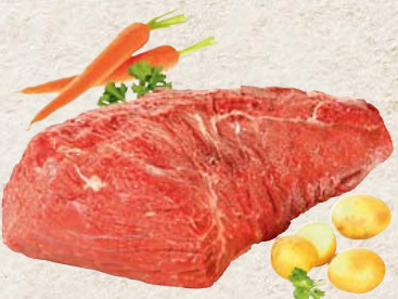
Frischer deutscher Wagyu Tafelspitz 100 g