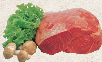
Frischer deutscher Wagyu Rinderbraten 100 g