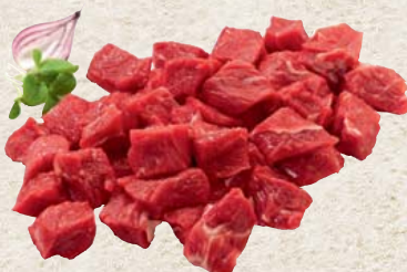
Frisches deutsches Wagyu Rindergulasch 100 g