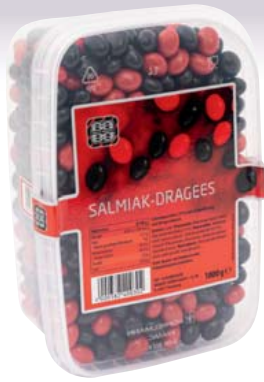
Agilus Salmiak Dragees 1000-g-Dose