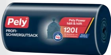
Pely Profi-Schwergutsäcke mit Verschlussband, blau, 120 l 18-Stück-Rolle