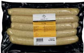
REGIONAL GLUTENFREI LAKTOSEFREI

Gourmet-Currybratwurst mit Kräutern und Ingwer verfeinert, gebrüht, nach eigener Rezeptur herge- stellt, 5 Stück à 140 g 700-g-Packung 1 kg = 11,99