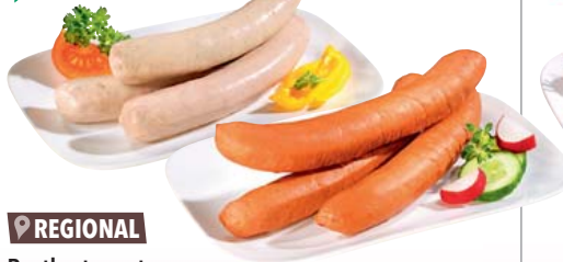
REGIONAL Rostbratwurst gebrüht oder Schinkengriller je 10 Stück à 100 g verpackt je 1 kg