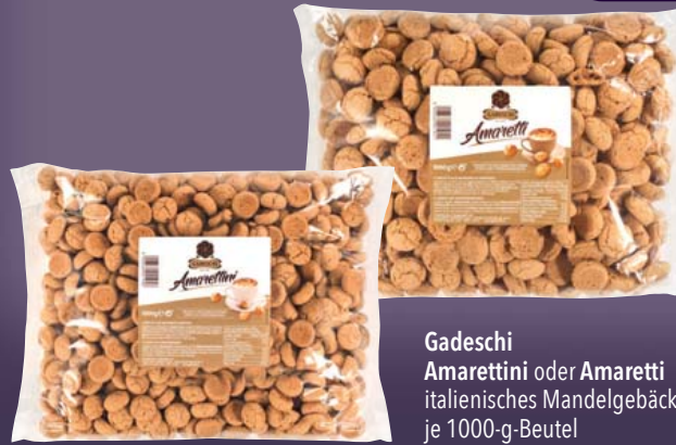
Gadeschi Amaretti oder Amaretti italienisches Mandelgebäck je 1000-g-Beutel