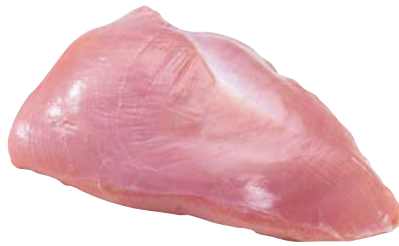
Frisches Putenbrustfilet ohne Haut und Knochen, vom Hahn, ca. 2,5 kg verpackt 1 kg