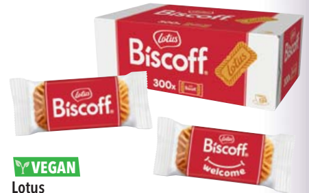
VEGAN Lotus Biscoff Karamellgebäck jeweils einzeln verpackt, Stück à 6,25 g, 300-Stück-Karton 1,875-g-Karton 1 kg = 7,46/St = 0,05