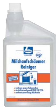
Dr. Becher Milchaufschäumer-Reiniger wirksam gegen Salmonellen, ent- fernt zuverlässig Milchstein 1-l-Flasche