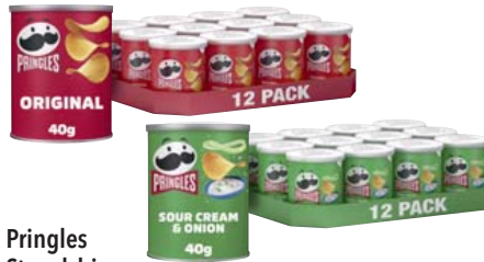
Pringles Stapelchips Original oder Sour Cream & Onion, je 12-Dosen-Karton je 40-g-Dose 1 kg = 19,75