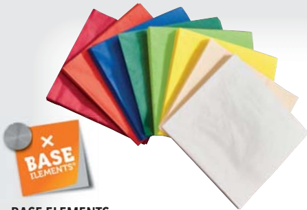
BASE ELEMENTS Servietten 33 x 33 cm, 3-lagig, 1/4 Falz, in verschiedenen Farben erhältlich je 250-Stück-Packung