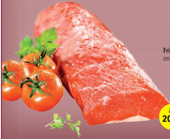
Frisches argentinisches Rumpsteak im Strang, ca. 3,5 kg