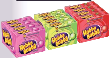
Hubba Bubba verschiedene Sorten, je 20-Packungen-Karton je 40-g-Packung 1 kg = 12,25