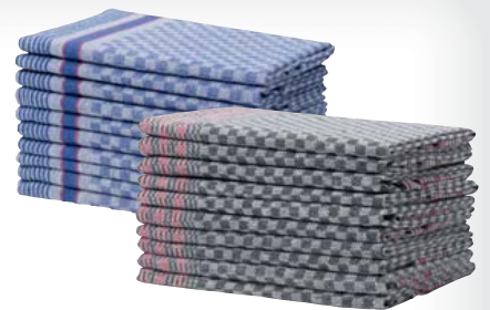
Home Style Creation Grubentuch Grubentücher im 10er-Pack, 100% Baumwolle, ca. 50 x 90 cm