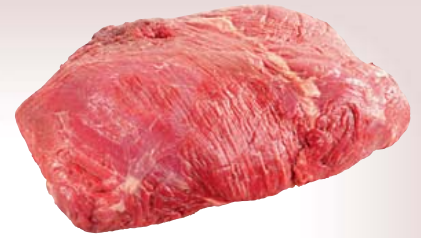
Frische argentinische Rindersteakhüfte sauber beschnitten, besonders mager, Stück ca. 2,5 kg