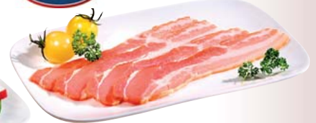
Bacon in Scheiben geräuchert, ca. 1-kg-Packung 1 kg