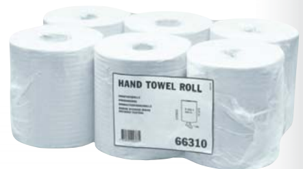
Tork Einmalhandtuchpapier Innenabrollung, 1-lagig 6 x 350-m-Rollen