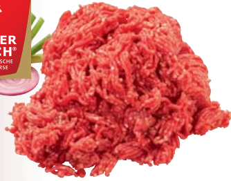
MEISTERFRISCH Frisches Rinderhackfleisch

laufend frische Herstellung, in der Küche vielseitig verwendbar, von Färsen aus Deutschland 1 kg