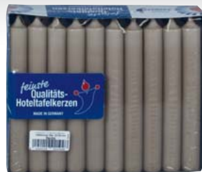
Jaspers Hotelkerzen 18 cm, in verschiedenen Farben erhältlich je 30-Stück-Packung