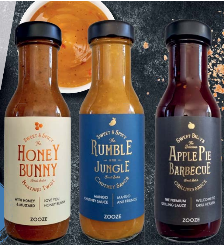
Zooze Honig Senf Sauce