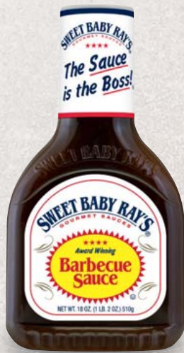
Sweet Baby Ray's BBQ Saucen verschiedene Sorten je 510-g-Flasche 1 kg = 7,82