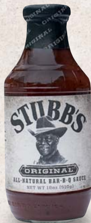
Stubb's BBQ-Sauce verschiedene Sorten, z.B. Brown Sugar, Jalapeño Honey oder Dr. Pepper je 510-g-Flasche 1 kg = 14,68