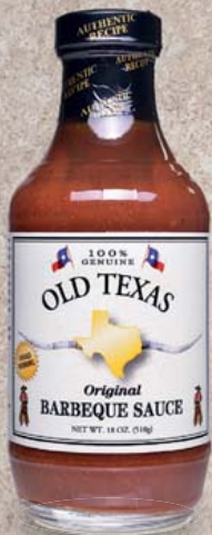
Old Texas Barbecue-Sauce verschiedene Sorten je 455-ml-Flasche 1 l = 15,36