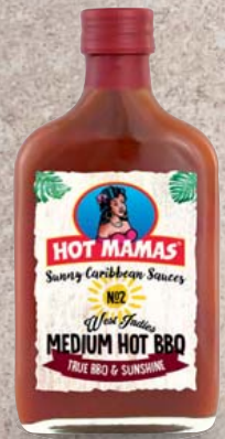
Hot Mamas BBQ Saucen nach original karibischem Rezept verschiedene Sorten je 195-ml-Flasche 1 l = 20,46