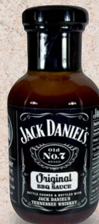
Jack Daniel's BBQ Sauce verschiedene Sorten je 473-ml-Flasche 1 l = 19,01