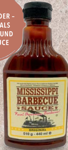
Mississippi Barbecue-Sauce Original oder Sweet&Spicy, Sweet&Mild, Sweet&Apple je 510-g-Flasche 1 kg = 7,82

DER ALLROUNDER - BELIEBT ALS BURGER- UND RIB-SAUCE