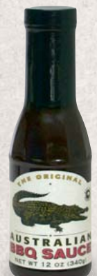
Original Australian BBQ Sauce verschiedene Sorten je 355-ml-Flasche 1 l = 18,28