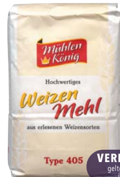
Weizenmehl Type 405 1-kg-Packung