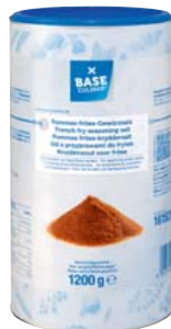
BASE CULINAR Pommes Frites Salz pikante Gewürzmischung für perfekt abgestimmte Pommes Frites 1,2-kg-Streudose 1 kg = 4,16