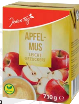
Jeden Tag Apfelmus 710-g-Packung 1 kg = 1,06