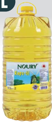
Rapsöl 10-l-Flasche 1 l = 1,39