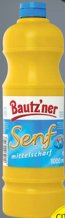
Bautzner Senf mittelscharf 1000-ml-Flasche