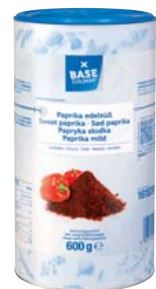
BASE CULINAR Paprika edelsüß hohe Würz- und Färbekraft, fruchtig- süß mit dezenter Schärfe 600-g-Streudose 1 kg = 9,98