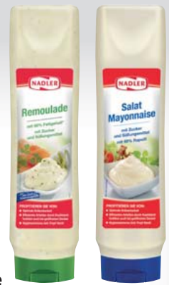
Nadler Remoulade oder Salatmayonnaise je 875-ml-Tube 1 l = 3,76