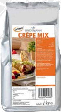
Westfalia Crêpe Mix 1-kg-Packung