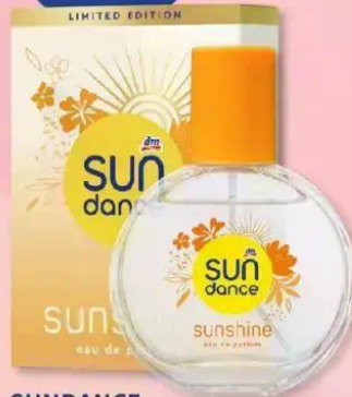
SUNDANCE Eau de Parfum sunshine