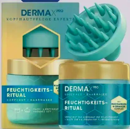
head&shoulders Kopfhautmaske DermaX Pro Feuchtigkeit-Ritual, inkl. Kopfhautmassager