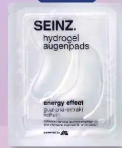
SEINZ. Hydrogel Augenpads Energy Effect