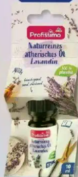
Profissimo Naturreines ätherisches Öl Lavandin