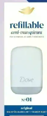
Dove Antitranspirant Deostick Refill Set Original