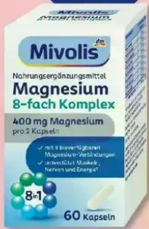
Mivolis Magnesium 8-fach Komplex