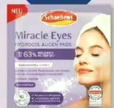
Schaebens Miracle Eyes Hydrogel Augen-Pads

* Bei regelmäßiger Anwendung von DermaX Pro Shampoo & Maske. * Klimische Anwendungsstudie zeigt nach 4-wöchiger Anwendung eine Reduktion der Faltentiefe um bis zu 63% (Ø 21%) und eine Verbesserung der Hautfeuchtigkeit um bis zu 220% (Ø 75%). Testzeitraum 02/2025. Informationen zum Test auf www.schaebens.de/art.2325 . Verträglichkeit dermatologisch und ophthalmologisch getestet und bestätigt. | Unsere Produkte sind ClimatePartner-zertifiziert. Dafür haben wir Emissionen berechnet und reduziert sowie Klimaschutzprojekte finanziert. dermatest.de