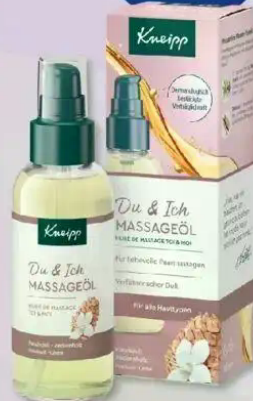
Kneipp Massageöl Du & Ich