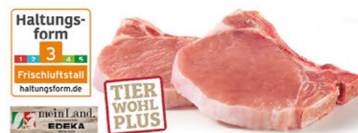
FRISCHE STIELKOTELETTS das schnelle Pfannengericht, 1 kg