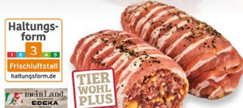
BACON CHEESE BOMB gefüllt mit Hackfleisch u. Käse, 100 g