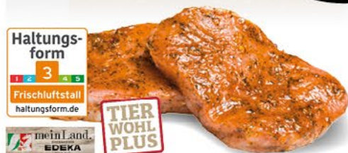
SCHWEINE- LACHSSTEAKS versch. mariniert, 100 g