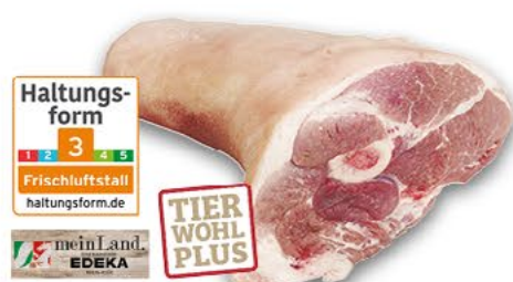
FRISCHES VORDEREISBEIN ideal für den Eintopf, 1 kg