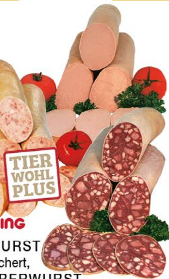
RASTING LEBERWURST fein, geräuchert, GUTSLEBERWURST im Naturdarm o. FLEISCHROTWURST im Naturdarm, 100 g