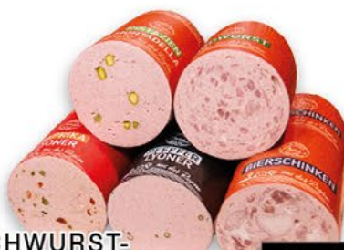
FRISCHWURST-AUFSCHNITT mehrfach sortiert, 100 g