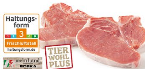
FRISCHE LUMMERKOTELETTS zart u. mager, 1 kg