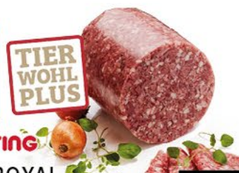
RASTING SÜLZE ROYAL mit süß-saurem Geschmack, 100 g