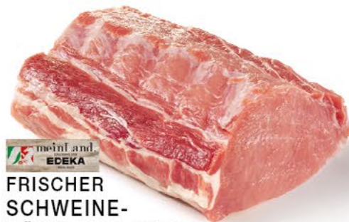
FRISCHER SCHWEINE- RÜCKENBRATEN ohne Knochen, besonders zart u. mager, 1 kg