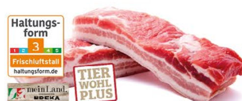
FRISCHER SCHWEINEBAUCH am Stück, mit Knochenanteil, 1 kg