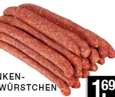
SCHINKEN-METTWÜRSTCHEN 100 g