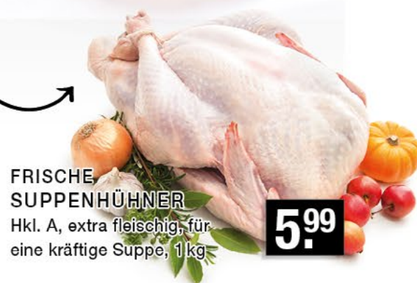
FRISCHE SUPPENHÜHNER Hkl. A, extra fleischig, für eine kräftige Suppe, 1 kg