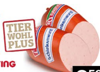
RASTING SCHINKENWURST 375 g Stück, 1 kg = 9,33 €