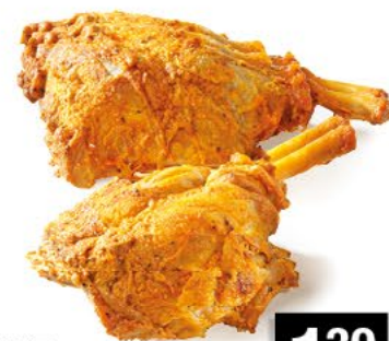
MINI GRILLHAXE vorgegart u. grillfertig, 100 g