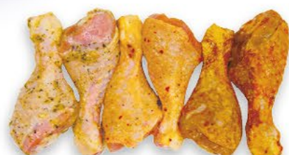
DRUMSTICKS Hähnchenunterkeulen, gewürzt, ideal zum Grillen, 1 kg