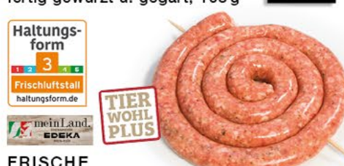
FRISCHE GRILLBRATWURST mit Kräutern, grob, im zarten Saitling, 100 g