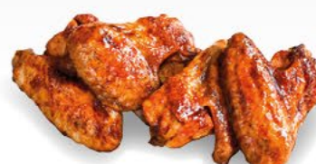
CHICKEN WINGS herzhaft gewürzte Hähnchenflügel, 1 kg