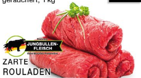
ZARTE ROULADEN „UNSERE BESTEN“ nur aus der Oberschale geschnitten, 100 g