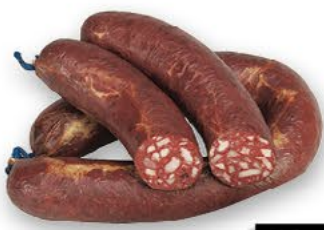
BLUTWURST im Ring, 100 g