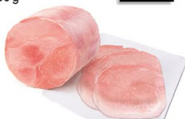
GEKOCHTER HINTERSCHINKEN saftig u. mager, 100 g