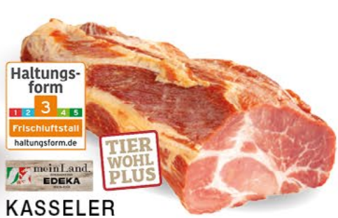
KASSELER NACKEN ohne Knochen, goldgelb geräuchert, 1 kg