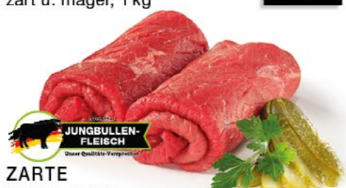
ZARTE ROULADEN aus den Kernstücken der Keule geschnitten, 100 g