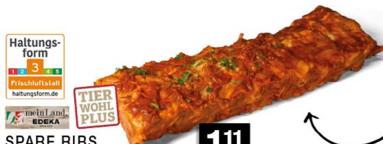
SPARE RIBS fertig gewürzt u. gegart, 100 g