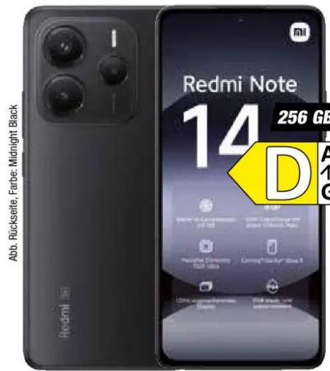
Abb. Rückseite, Farbe: Midnight Black

33% GESPART ggü. UVP* 149,- 1) OUTLET PREIS 99,-