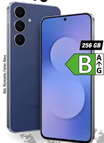
Abb. Rückseite, Farbe: Navy