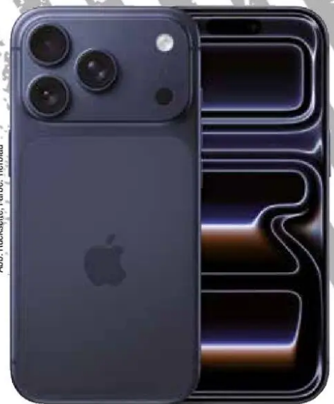
Abb. Rückseite, Farbe: Tiefblau