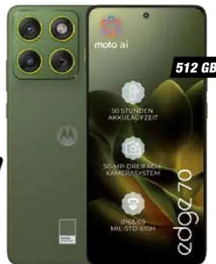
Abb. Rückseite, Farbe: Pantone Bronze Green