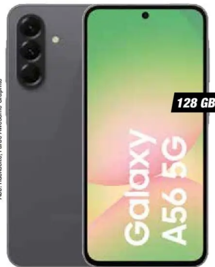
Abb. Rückseite, Farbe: Awesome Graphite

motorola moto edge 60 pro (8 GB / 256 GB) • 6,67" (16,94 cm) Super-HD-pOLED-Display mit Corning® Gorilla® Glass 7i • 50-MP-Sony LYCIA™-Kamera mit Ultra-Weitwinkel/Makro/Tele und moto ai Web-Code: 15075812184