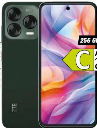
Abb. Rückseite, Farbe: Stone Gray