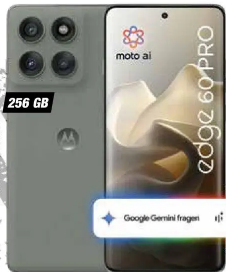
Abb. Rückseite, Farbe: Pantone Shadow

1)-5) & M) Alle weiterführenden Infos und Inhalte der Tarife erhältst Du direkt unter www.expert.de/tarifinfo oder einfach nebenstehenden QR-Code einscannen