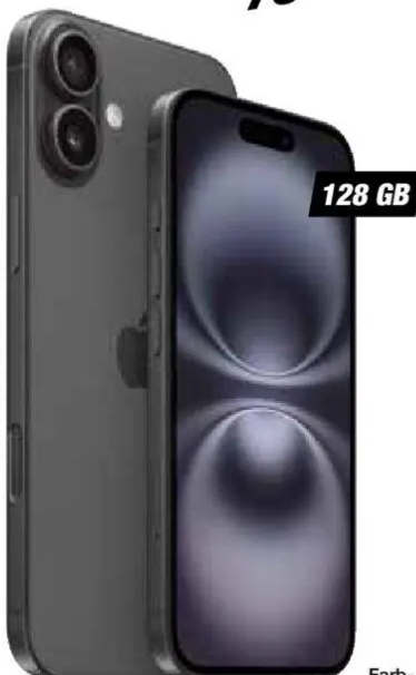
Abb. Rückseite, Farbe: Schwarz