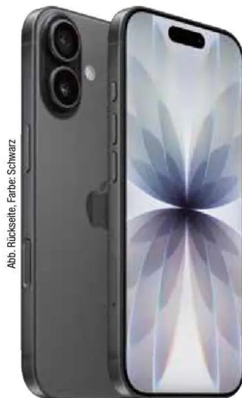
Abb. Rückseite, Farbe: Schwarz