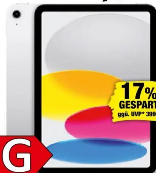
Abb. Rückseite, Farbe: Silber