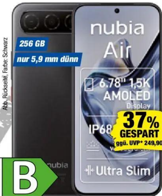
Abb. Rückseite, Farbe: Schwarz