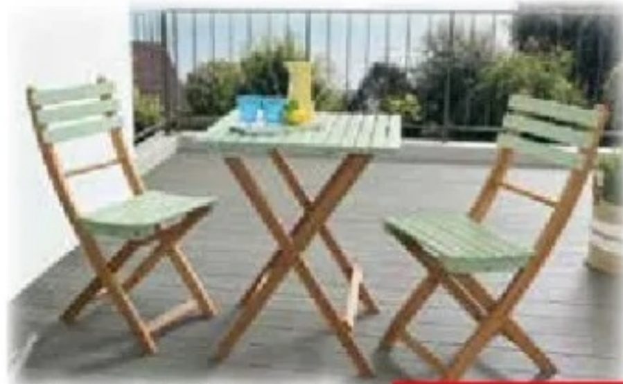
Balkon-Set Wien 3tlg. aus Akazienholz, klappbare Stühle, Tisch ca. 60 x 60 cm, für den Innen- und Außenbe- reich geeignet, Art.Nr.: 25801103