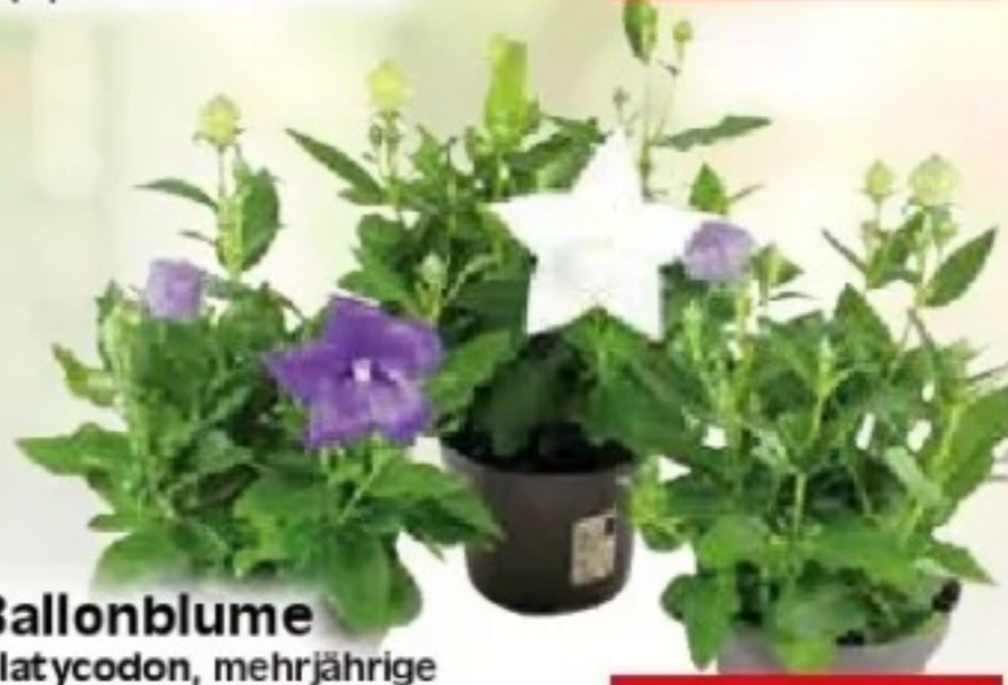
Ballonblume Platycodon, mehrjährige Blütenstaude für sonnigen bis halbschattigen Standort in Steingarten, Staudenbeet oder auch Beet und Balkon- bepflanzung, versch. Farben, 12 cm Topf, Art.Nr.: 89000508