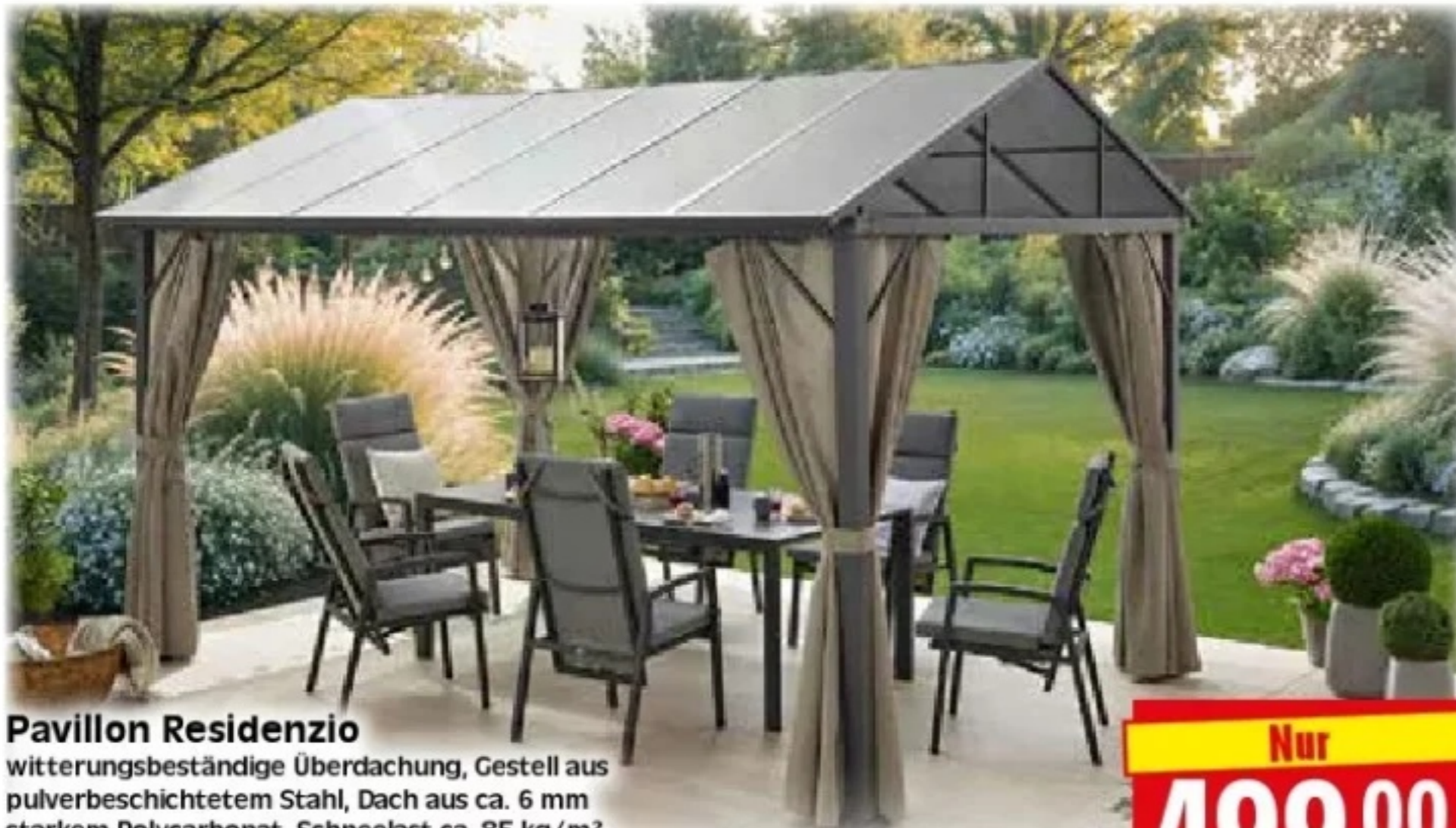
Pavillon Residenzio witterungsbeständige Überdachung, Gestell aus pulverbeschichtetem Stahl, Dach aus ca. 6 mm starkem Polycarbonat, Schneelast ca. 85 kg/m 2 , inkl. Vorhänge, Maße ca. B 395 x H 201/260 x T 297 cm, auf Bestellung erhältlich, ohne Dekoration, Art.Nr.: 25875180

Nur 499.00 0% Finanzieren** 12 x 41.59 €