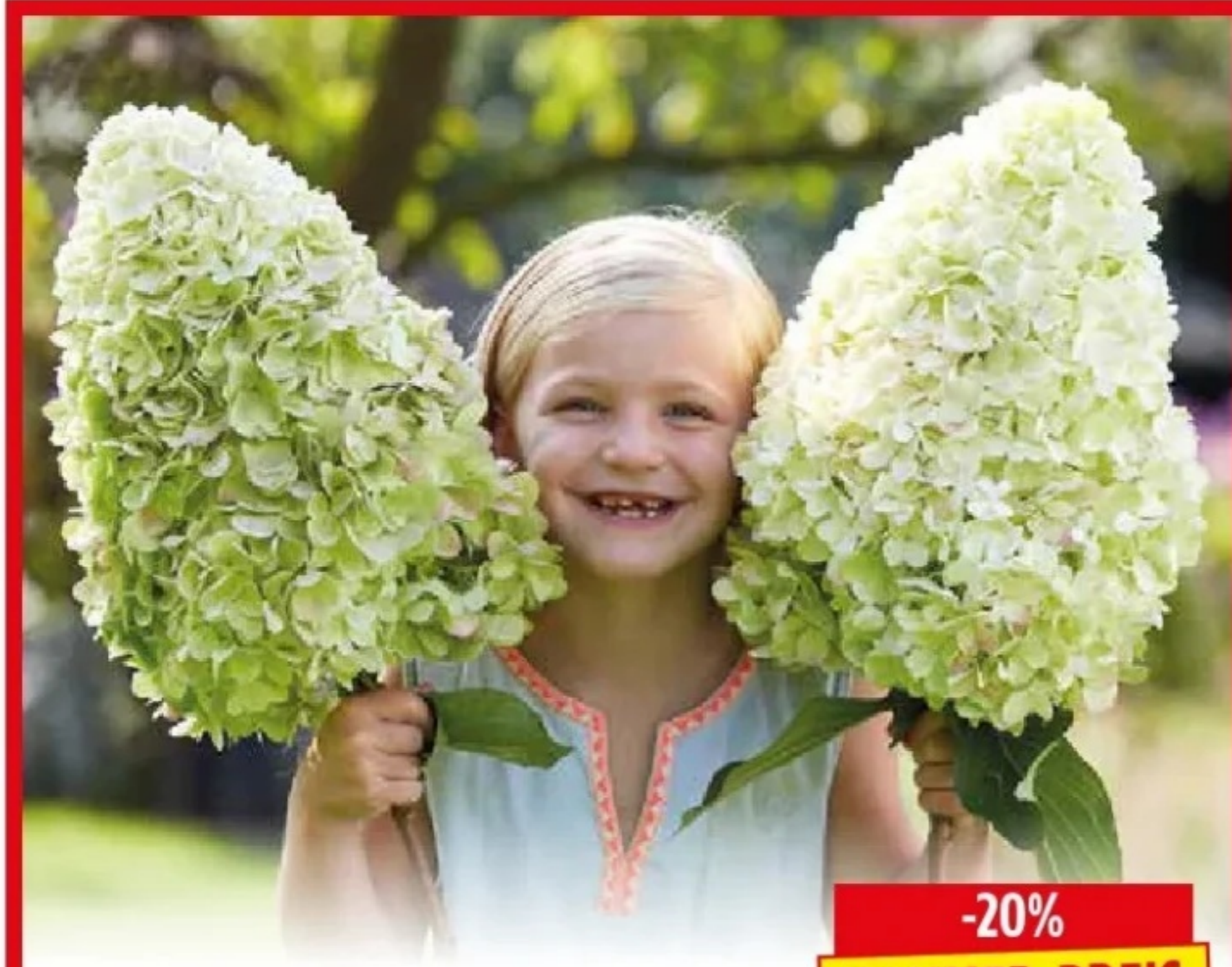
Rispenhortensie HERCULES Hydrangea paniculata, dichte, riesige Rispen mit einer Vielzahl weiss-grünen Blüten mit einem rosa Schimmer auf starken Stielen, für Beet-, Balkon und Terrasse, 5 l Topf, Art.Nr.: 25331635