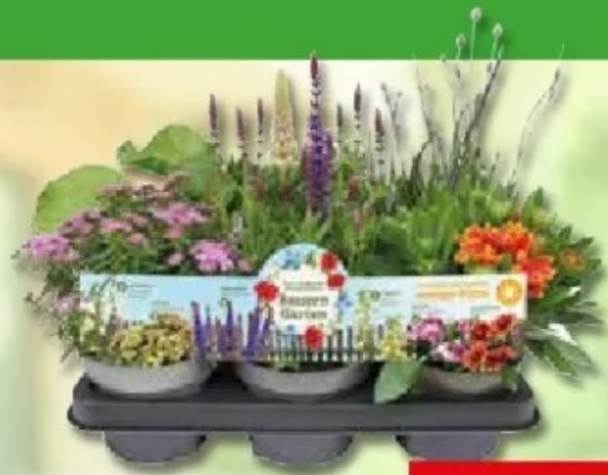
Staudensortiment Bunter Bauern Garten für sonnige und schattige Standorte, 13 cm Topf, Art.Nr.: 89460391