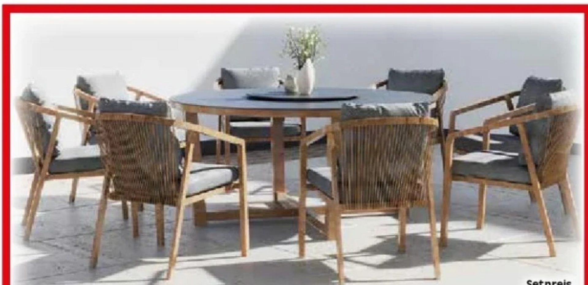
Sitzgruppe Kanto Material: Aluminium, Farbe: Holzoptik, Tischplatte: Fairstone mit Lazy Suzan Funktion (Drehteller in der Mitte), bestehend aus: 6 Stühlen, 1 Tisch, Maße ca. Ø 159 x 76 cm, Art.Nr.: 25375208

HAMMER-PREIS 1099.00 0% Finanzieren** 12 x 91.59 €