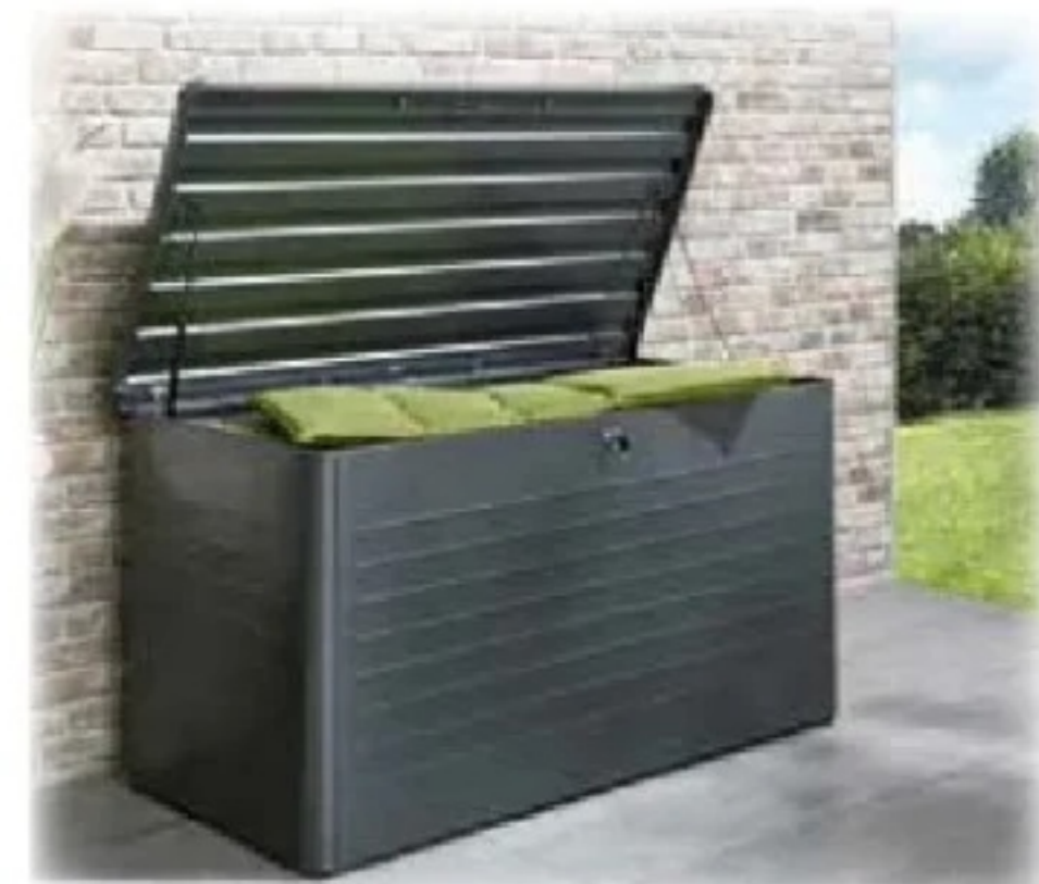
Kissenbox aus Stahl, Maße ca. 160 x 79 x 83 cm (BxTxH), witterungs- beständig, wasserdicht, winterfest, UV-beständig, Art.Nr.: 25604340

Nur 499.00 0% Finanzieren** 12 x 41.59 €