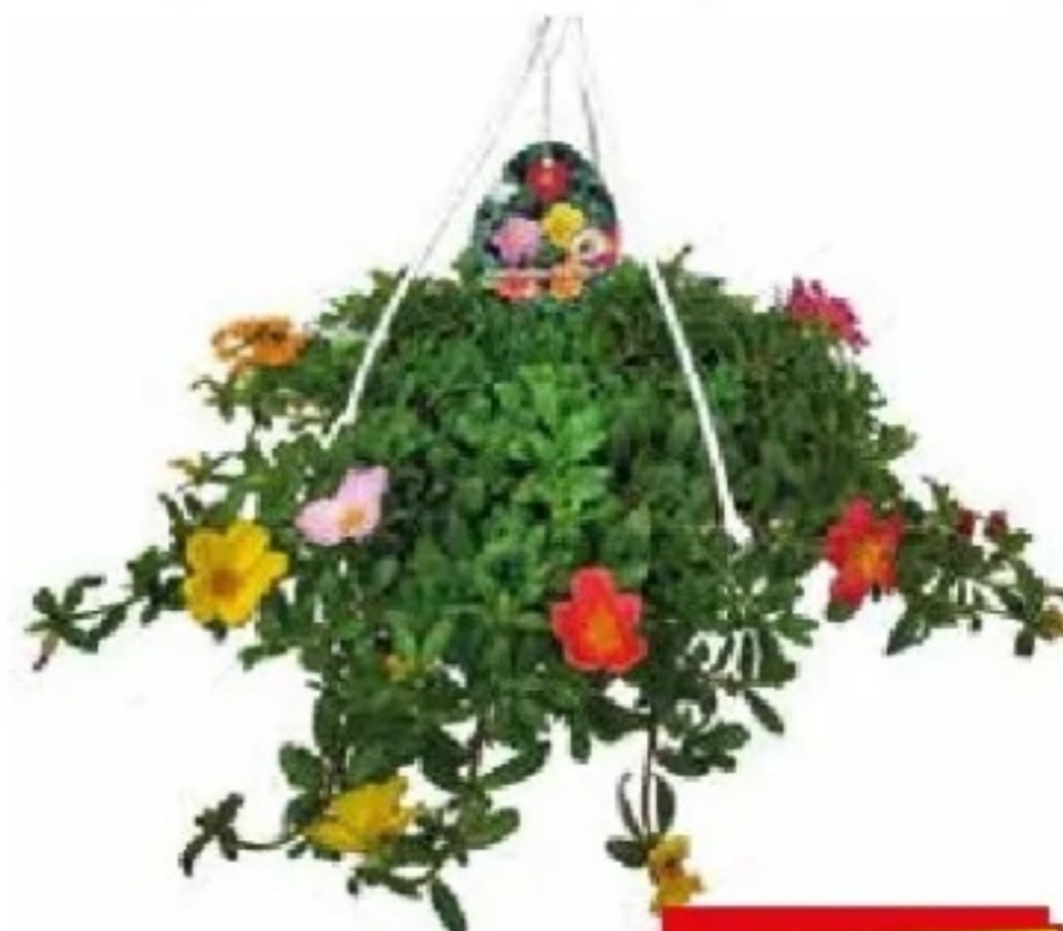
Portulakröschen Trockenkünstler für sonnigen Standort, 5-6 leuchtende Farben, im 22 cm Ampeltopf, Art.Nr.: 89146589