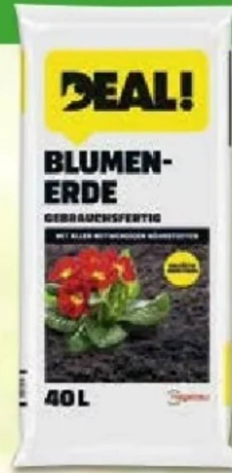
DEAL! Blumenerde Art.Nr.: 25876763