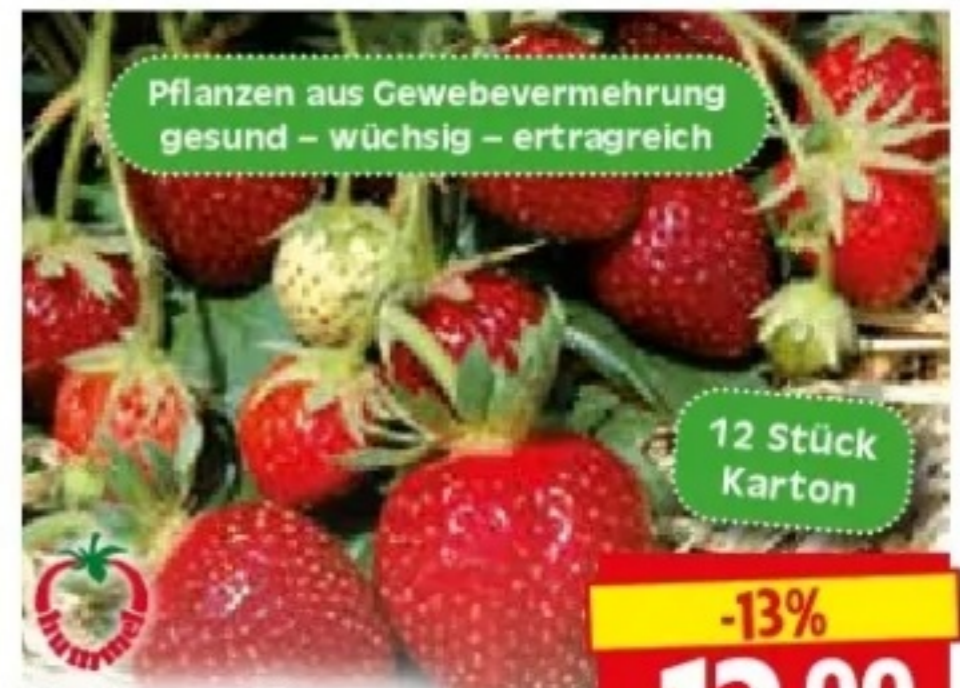
Erdbeerpflanzen getopft, verschiedene Sorten, Art.Nr.: 20304713