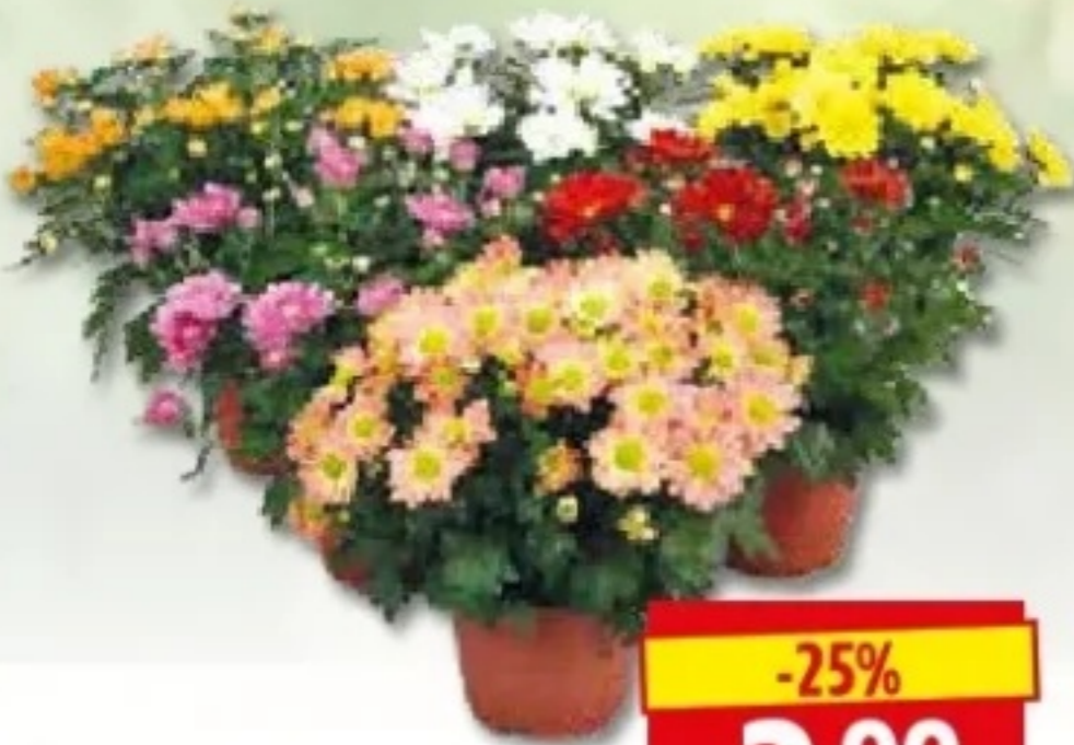
Topf-Chrysanthemen verschiedene Farben, 13 cm Topf, Art.Nr.: 89207590