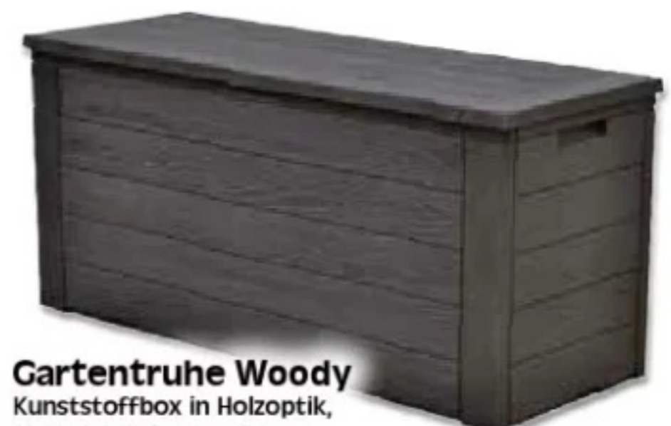
Gartentruhe Woody Kunststoffbox in Holzoptik, Material: Polypropylen mit 2 Tragegriffen und Abschließvorrichtung zum Anbringen eines Vorhänge- schlosses, Maße ca. 120 x 45 x 60 cm, Art.Nr.: 2213186003

HAMMER-PREIS 1099.00 0% Finanzieren** 12 x 91.59 €