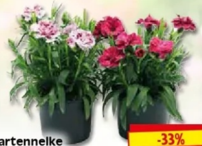
Gartennelke Dianthus caryoph., für sonnigen bis halbschattigen Standort, verschiedene Farben, 11 cm Topf, Art.Nr.: 89011485