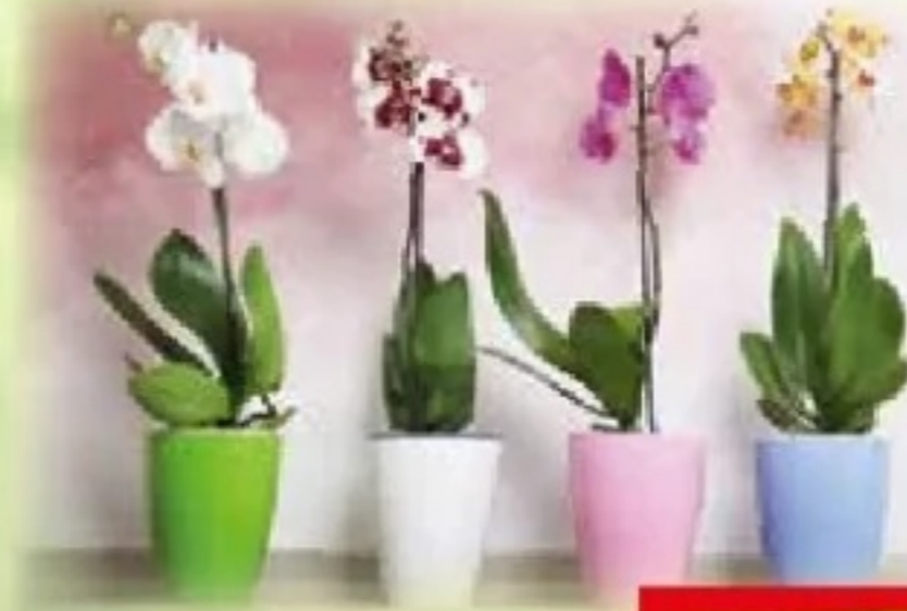
Phalaenopsis Zimmerorchidee für hellen, halbschattigen Standort, ohne Über- topf, Art.Nr.: 20696689