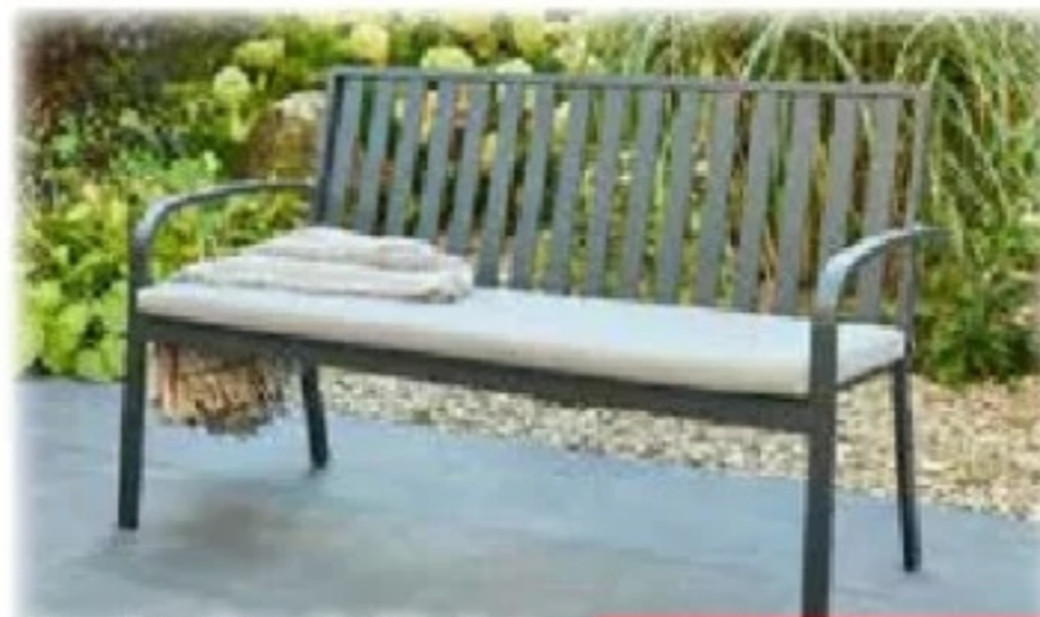
Gartenbank Sinfra aus Aluminium, bietet Platz für 3 Personen, Maße ca. 90 x 150 x 64 cm (HxBxT), inkl. Sitzkissen, Art.Nr.: 25801240