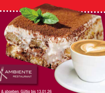
Abb. beispielhaft. Ausschneiden & abgeben. Gültig bis 13.01.26