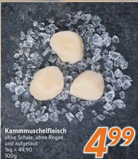
Kammuschelfleisch ohne Schale, ohne Rogen und aufgetaut 1kg = 49,90 100g