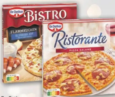
Dr. Oetker Ristorante, Piccola oder Flammkuchen versch. Sorten, gefroren, z.B.: Salame 320g, Flammkuchen Elsässer Art 265g 1kg = 5,59/6,76 Packung