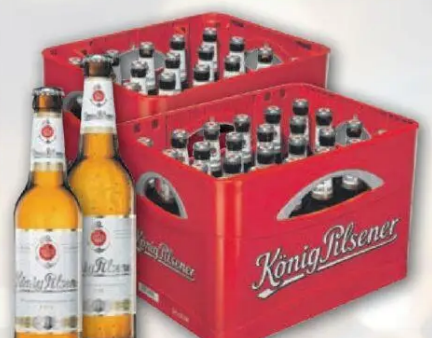
König Pilsener versch. Sorten, + 3,42/3,10 Pfand je nach Verfügbarkeit im Markt 1l = 1,39/1,10 24x0,33l/20x0,5l Flasche