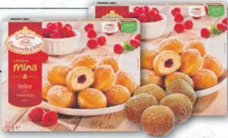
Coppenrath & Wiese Cafeteria Mini-Berliner gefroren 1kg = 12,69 175g Packung