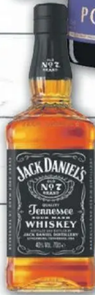
Jack Daniel's versch. Sorten 1l = 22,84 0,7l Flasche