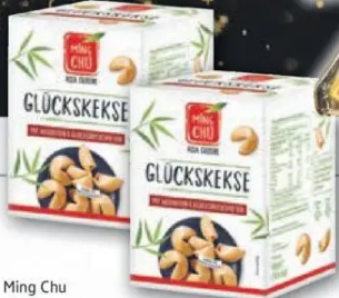
Ming Chu Glückskekse mit Weisheiten und Glücksbotschaften 1kg = 18,50 10x6g = 60g Packung

Partyzubehör in großer Auswahl erhältlich!