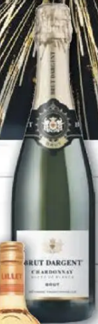
Frankreich Brut Dargent Sekt, versch. Sorten 1l = 7,99 0,75l Flasche