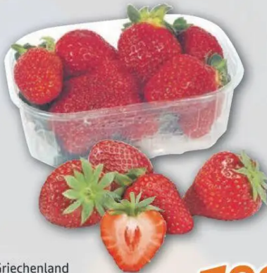
Griechenland Erdbeeren Kl. I 1kg = 7,96 250g Schale