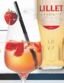
Lillet Aperitif de France, versch. Sorten 1l = 14,65 0,75l Flasche