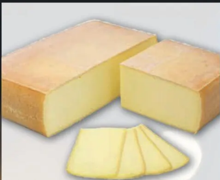
Schweizer Raclette-Käse ideal für Raclette oder Fondue, würziger Geschmack, 48% Fett i. Tr. 1kg = 12,90 100g