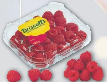
Marokko Driscoll's Himbeeren Kl. I 1kg = 11,92 125g Packung