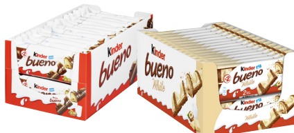
Kinder Bueno · Verschiedene Sorten je 30 x 2x 21,5-g-Karton