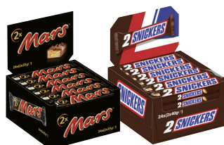
Mars/Snickers Großriegel · Verschiedene Sorten je 24er-Karton