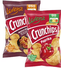
Lorenz Crunchips · Verschiedene Sorten 150-g-Beutel