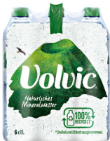
Volvic Mineralwasser • Verschiedene Sorten 6 x 0,75-l / 1-l-Flasche (zzgl. Pfand)