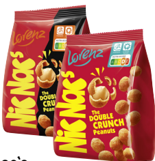
Nic Nac's · Verschiedene Sorten 110-g-Packung