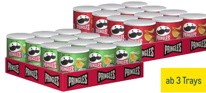
Pringles · Verschiedene Sorten 12 x 40-g-Tray