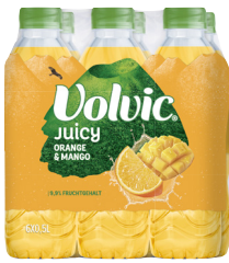
Volvic Juicy • Verschiedene Sorten 6 x 0,5-l-Flasche (zzgl. Pfand)