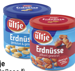
Ültje Erdnüsse 2) · Verschiedene Sorten 180-g-Dose