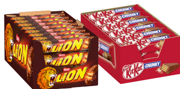
Nestlé Kitkat/ Kitkat Chunky/ Lion/Nuts · Verschiedene Sorten je 24/30 x 26-/42g Karton