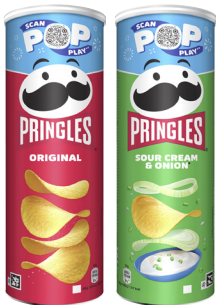
Pringles · Verschiedene Sorten 160-/165-g-Dose