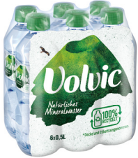
Volvic Mineralwasser 6 x 0,5-l-Flasche (zzgl. Pfand)