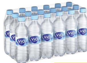
Vio Mineralwasser • Verschiedene Sorten 18 x 0,5-l-Flasche (zzgl. Pfand)