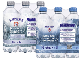
Gerolsteiner Mineralwasser • Verschiedene Sorten 6 x 0,5-l-Flasche (zzgl. Pfand)