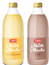
Turm Milchkacao/ Kakao • Verschiedene Sorten 500-ml-Flasche