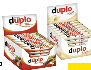
Ferrero Duplo · Verschiedene Sorten je 40 x 18,2-g-Karton