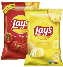
Lays Chips · Verschiedene Sorten 150-g-Beutel