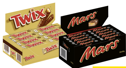
Mars/Snickers/Twix · Verschiedene Sorten je 32er-Tray