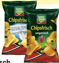
Funny Frisch Chipsfrisch · Verschiedene Sorten 150-g-Beutel