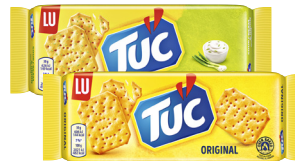
Tuc Cracker · Verschiedene Sorten 100-g-Packung