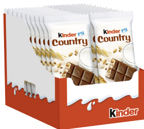
Kinder Country 20 x 23,5-g- Karton