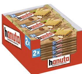
Hanuta 18 x 2 x 22g- Karton