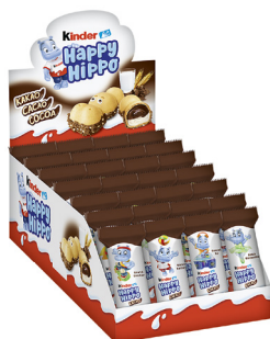
Kinder Happy Hippo Cacao 28 x 20,7-g- Karton