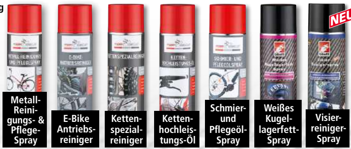
Metall-Reinigungs- & Pflege-Spray