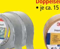
Doppelseitiges Klebeband 3er-Set