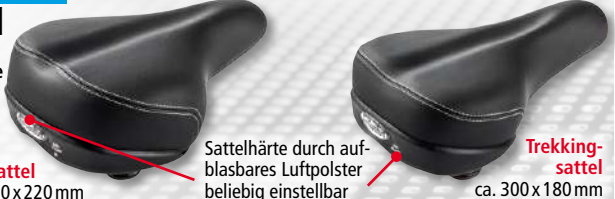
Citysattel ca. 270 x 220 mm