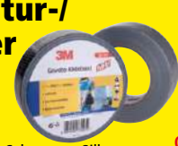
Schwarz + Silber