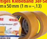
Doppelseitiges Klebeband 3er-Set