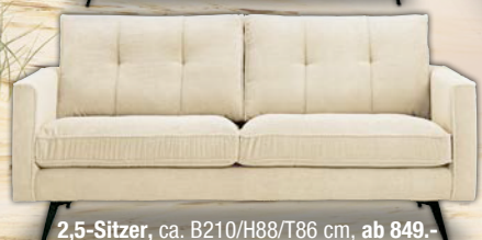
2,5-Sitzer, ca. B210/H88/T86 cm, ab 849.-