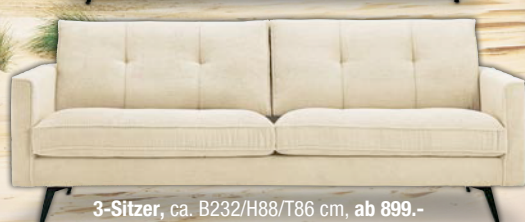
3-Sitzer, ca. B232/H88/T86 cm, ab 899.-

Das Sofa-Programm SANSIBAR® OSTLAND erinnert an das nordische Design der Insel Sylt. Die komfortable Polsterung verleitet zum Chillen und Träumen. Überzeugen auch Sie sich vom Charme dieses wunderschönen Sofasystems.