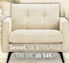
Sessel, ca. B105/H88/T86 cm, ab 549.-