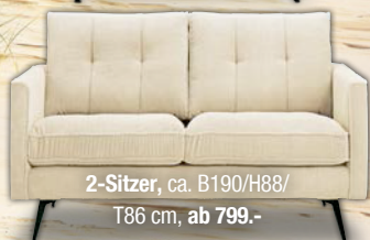
2-Sitzer, ca. B190/H88/T86 cm, ab 799.-