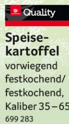
Speise- kartoffel vorwiegend festkochend/ festkochend, Kaliber 35–65 699 283 10-kg-Sack