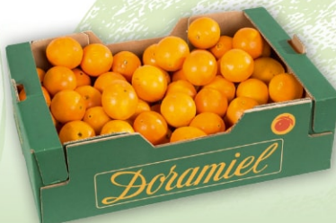
Saftorangen Valencia Ägypten, Klasse II, Kaliber 5–7 101 012 15-kg-Kiste