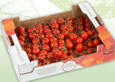
Tomate Cherrystrauch Italien, Klasse I 547 786 3-kg-Kiste