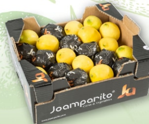
Zitronen Spanien, Klasse I 382 152 5-kg-Kiste