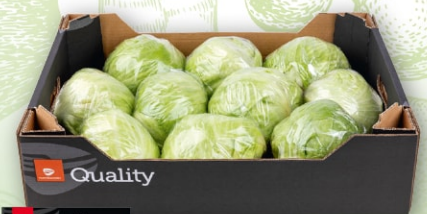
Eisbergsalat Spanien, Klasse I, Kaliber 450–600 g 196 746 10er-Kiste