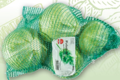
Weißkohl Deutschland, Klasse II 276 957 10-kg-Sack