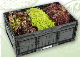
Mix Salat Italien, Klasse I, 275–375 g 415 553 9er-Kiste