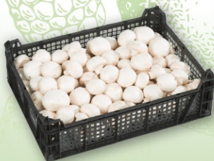
Champignons weiß Polen, Klasse I, Kaliber 30–65 574 582 3-kg-Kiste

Das gesamte Selgros-Team freut sich auf Deinen Besuch!