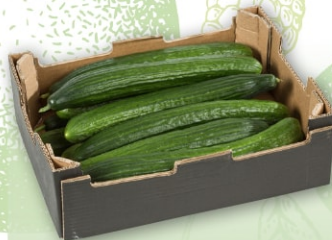
Gurke Spanien/Niederlande, Klasse I, 300–400 g 415 208 14er-Kiste