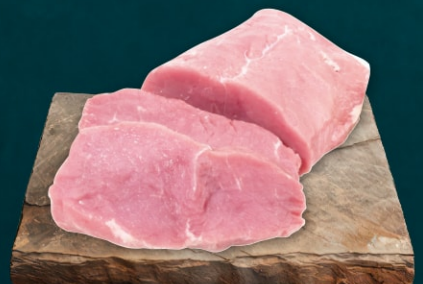
Kalb Semerrolle Rosé

Herkunft: EU, frisch, Stück ca. 1 kg 389 856 kg