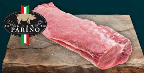
Gran Parino Schweinerücken (Lachse)

Herkunft: Italien, frisch, Gewicht ca. 2 – 4 kg 413 231 kg